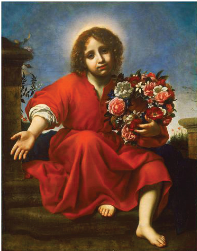
Карло Дольчи – «Юный Христос с букетом цветов»