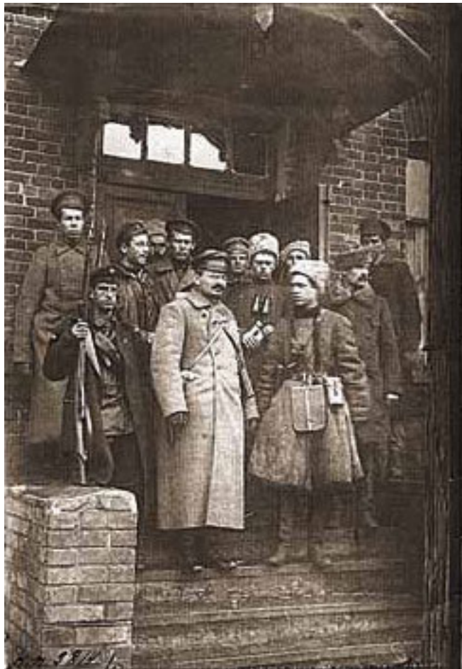
Троцкий Л. Д. на станции Лиски. 1918 г.

Председатель Реввоенсовета республики пытался находить общий язык и с нелояльными большевикам элементами. Так, весной 1919 г. Троцкий предложил интегрировать в Красную Армию анархистов Нестора Махно путем присылки в «анархистские банды» махновцев отрядов парработников, чекистов, матросов и рабочих.