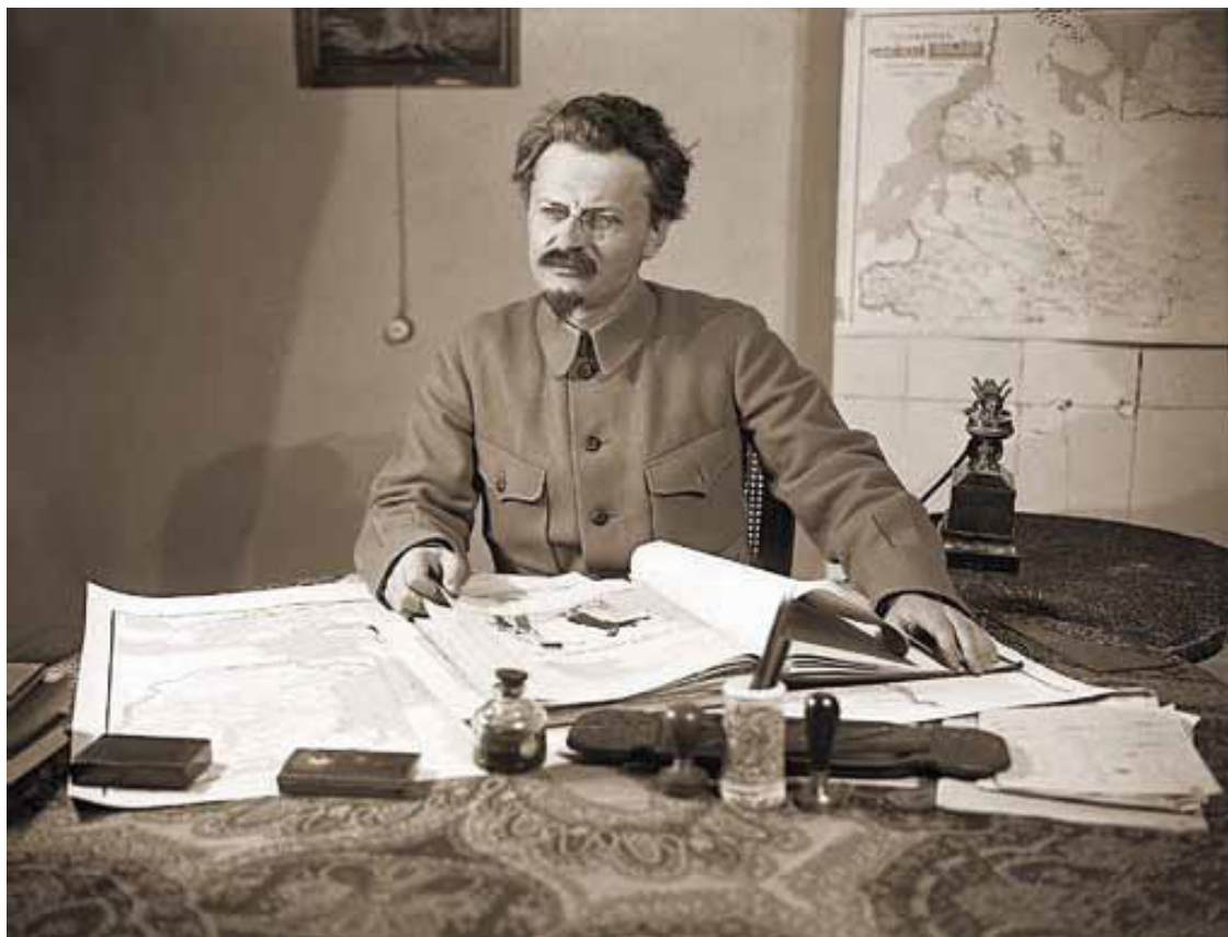
Троцкий Л. Д. сидит за столом, рассматривает альбом. Москва, 1918 г. (?)