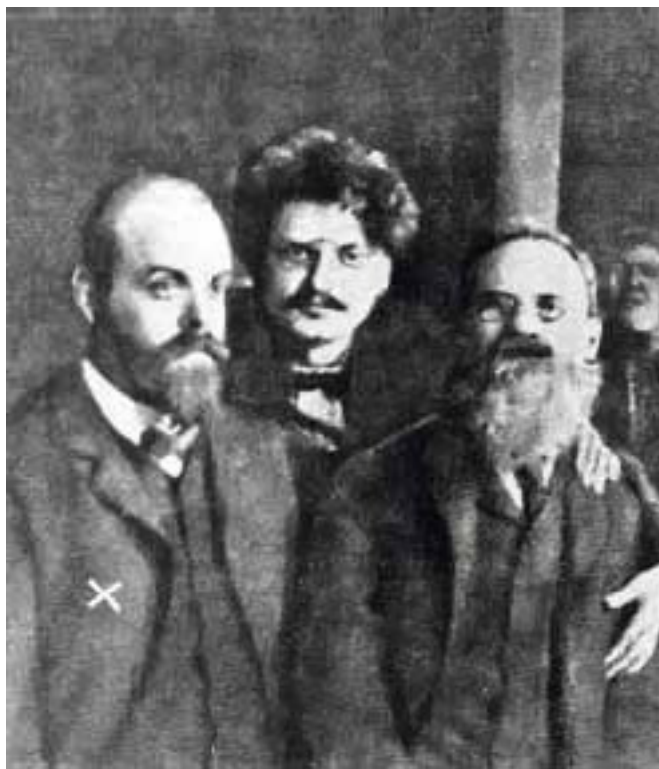
Парвус (псевдоним А. Л. Гальдронда), Л. Д. Троцкий и Л. Г. Дейч в доме предварительного заключения. г. С.-Петербург 1906 г.

Под руководством Троцкого оформился военно-административный аппарат Советской России, были созданы военные округа, армии и фронты, в разложенной революционным брожением стране осуществлены массовые мобилизации. Красная Армия одержала свои победы над внутренней контрреволюцией.