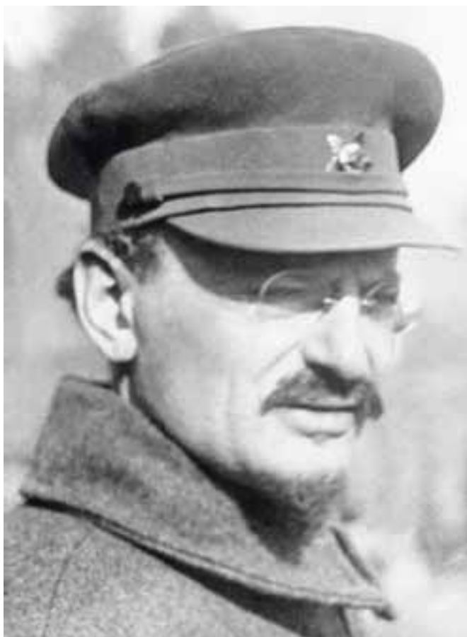
Троцкий в красноармейской форме Москва 1919–1920 гг.

Троцкий всячески способствовал распространению в РККА военных знаний, развитию военной науки. Так, при его покровительстве группой бывших офицеров в Москве издавался серьезный военно-научный журнал «Военное дело».