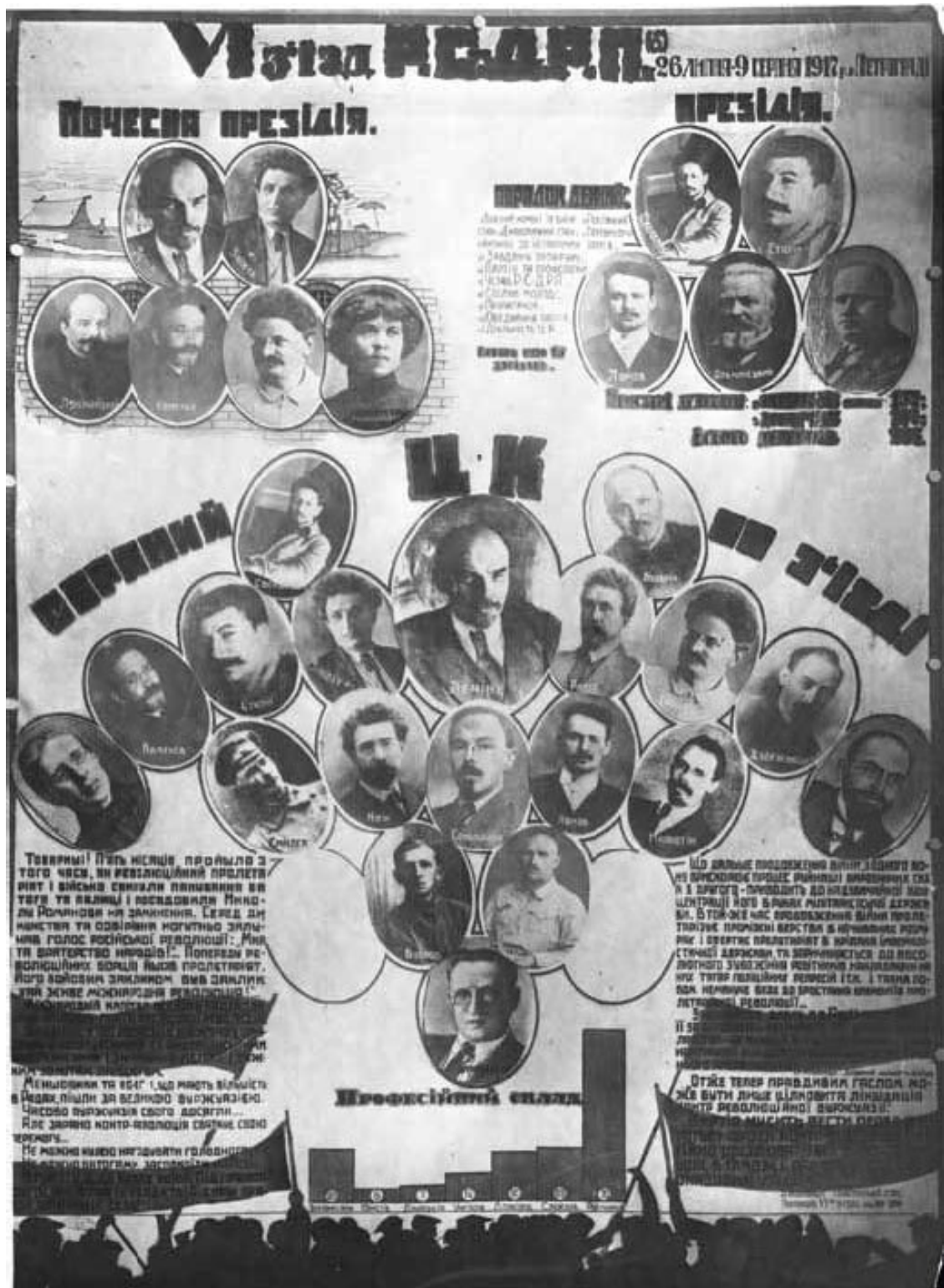
Фотомонтаж. VI съезд РСДРП(б) 26 февраля – 3 августа 1917 г. (на украинском языке): Зиновьев, Рыков, Троцкий, Милютин, Бухарин, Каменев, Иоффе. г. Петроград, 1917.