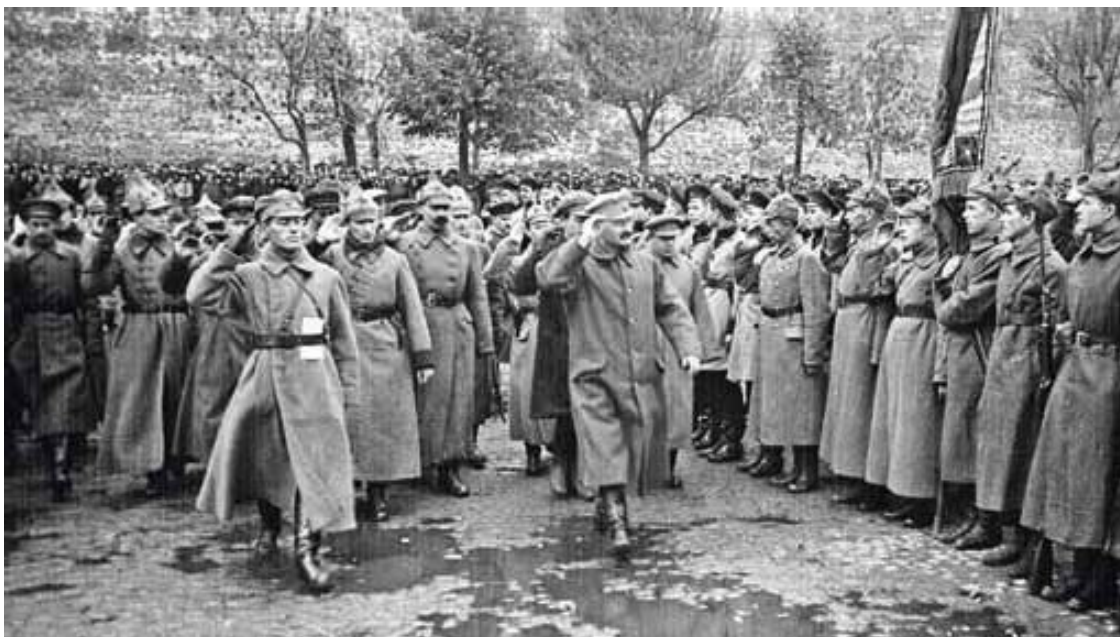
Объезд Л. Б. Троцким частей, отправляющихся на польский фронт. г. Москва, 1920 г.