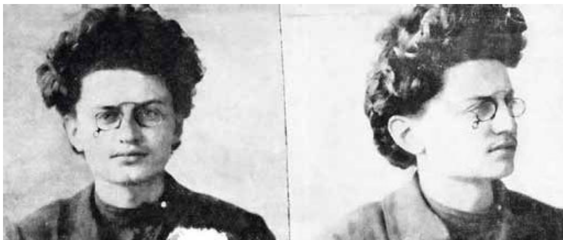
Троцкий Л. Д. 1906 г.

В конце 1917 – начале 1918 гг. Троцкий занимал пост народного комиссара по иностранным делам. Выступил сторонником неудачной политики «ни мира ни войны», в результате чего оставил пост наркома.