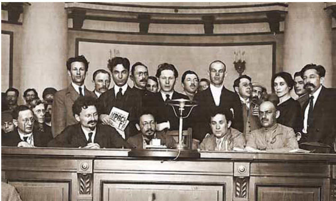
Президиум II съезда Советов Союза коммун Северной области. В группе – Троцкий, Зиновьев, Лашевич, Стасова, Крестинский, Зорин, Свердлов. г. Петроград 1918 г.

Самое горячее время Гражданской войны Троцкий провел в разъездах по фронтам в своем знаменитом поезде («летучий аппарат управления», как называл его Троцкий), организуя войска на местах. Неоднократно выезжал на наиболее угрожаемые фронты и налаживал там работу. Выдающийся вклад в дело укрепления фронта он внес под Казанью в августе 1918 г., когда Красная Армия оказалась деморализована. Троцкий смог укрепить боевой дух войск карательными мерами, пропагандой и усилением группировки советских войск в районе Казани.