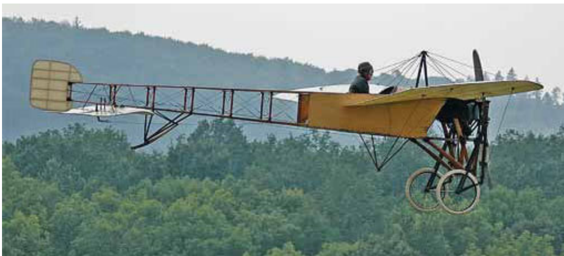
Blériot XI постройки 1914–1918 годов.

Еще в 1900 году Блерио построил орнитоптер Blériot I, так и не поднявшийся в воздух, а в 1907 году – первый аэроплан. 25 июля 1909 года в 4.35 утра Блерио поднялся в воздух. На середине пути из-за сильного ветра самолет отклонился от курса на север, постепенно стал уходить в открытое море, но Блерио вовремя заметил неладное по курсам кораблей в море и повернул на запад, к Дувру. 37 минут спустя, преодолев 23 мили, Блерио благополучно приземлился на английской земле. Самолет, на котором Блерио пересек Ла-Манш, был его одиннадцатым созданием; в отличие от Райтов, годами доводивших до совершенства одну и ту же базовую конструкцию, Блерио испробовал самые разнообразные конструкции; его бипланы оказались неудачными, в серию пошел только Blériot XI, спроектированный Раймондом Солнье. Машина впервые поднялась в воздух 23 января 1909 года.