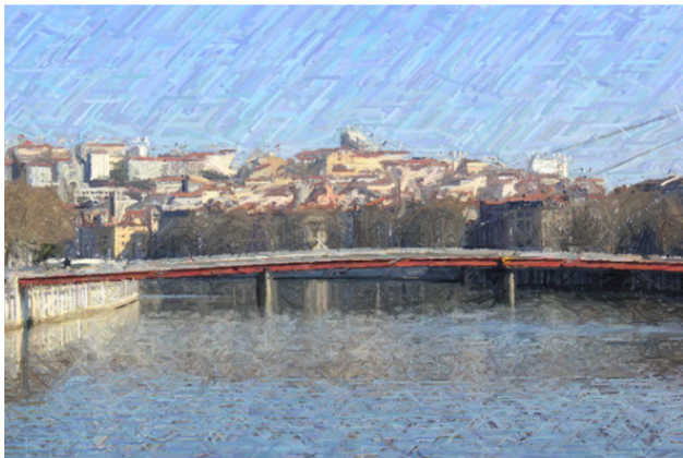
Пешеходный мост Дворца правосудия, Лион.

Селия любила гулять по Старому Лиону. Разглядывая людей, витрины, здания, заходя во внутренние дворики, которые скрывали маленькие сокровища средневековой архитектуры и узкие трабули 15 , она невольно заражалась этим туристическим вирусом. Каждый раз, приходя в это место, она обязательно открывала для себя что-нибудь новое и интересное. Но в этот раз ей было некогда тратить время на блуждание по Старому Лиону. Ее ждали неведомые, но важные свершения, ее ждали Помпеи!