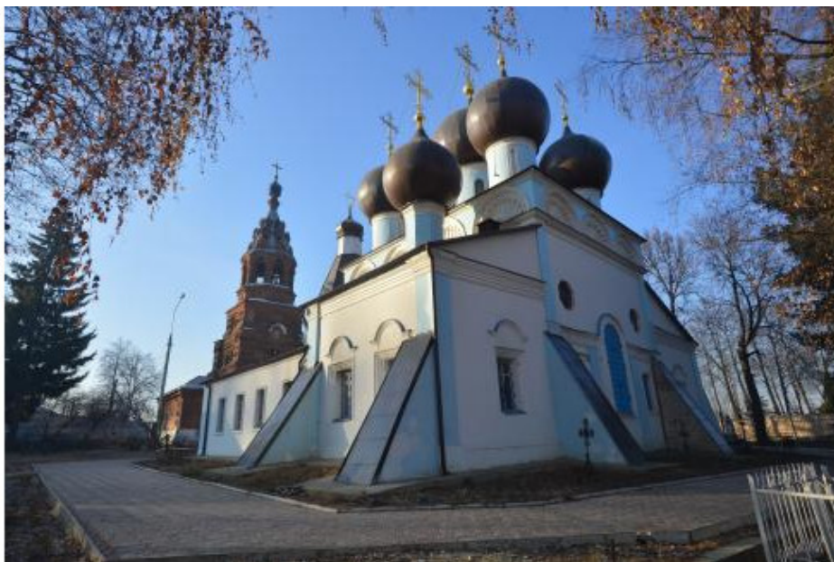
Храм во имя Троицы Живоначальной села Чашниково

Пока живы ручейки и роднички – морям и океанам не о чем беспокоиться.