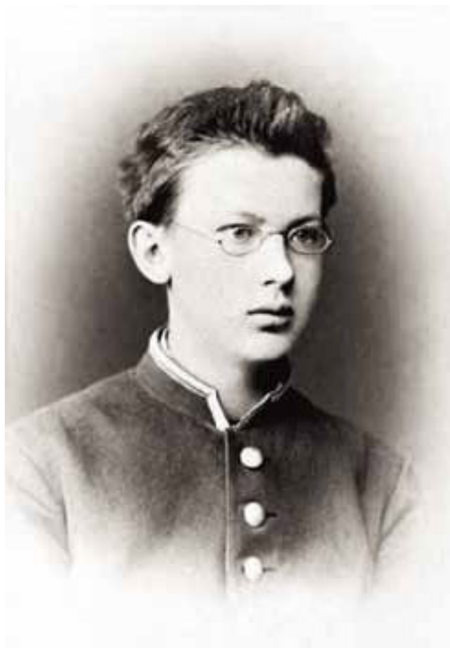
Володя Вернадский, гимназист 1-й Петербургской гимназии, 1878 год.

Владимира уже в 14 лет начинала интересовать политика. Он внимательно следил за Балканской войной. Внутренняя политика страны его интересовала не меньше, чем внешняя. Он писал в дневнике обо всем, что происходило. Например, о «Казанской истории» (преследовании народников и суде над ними возле Казанского собора в 1877 году) он отзывался с неодумением. Вернадский удивлялся тому, что государь устроил такую демонстративную и жестокую расправу над почти еще детьми. Самому старшему из осужденных было 22 года, а были и несовершеннолетние, притом никто не получил и шанса себя оправдать.