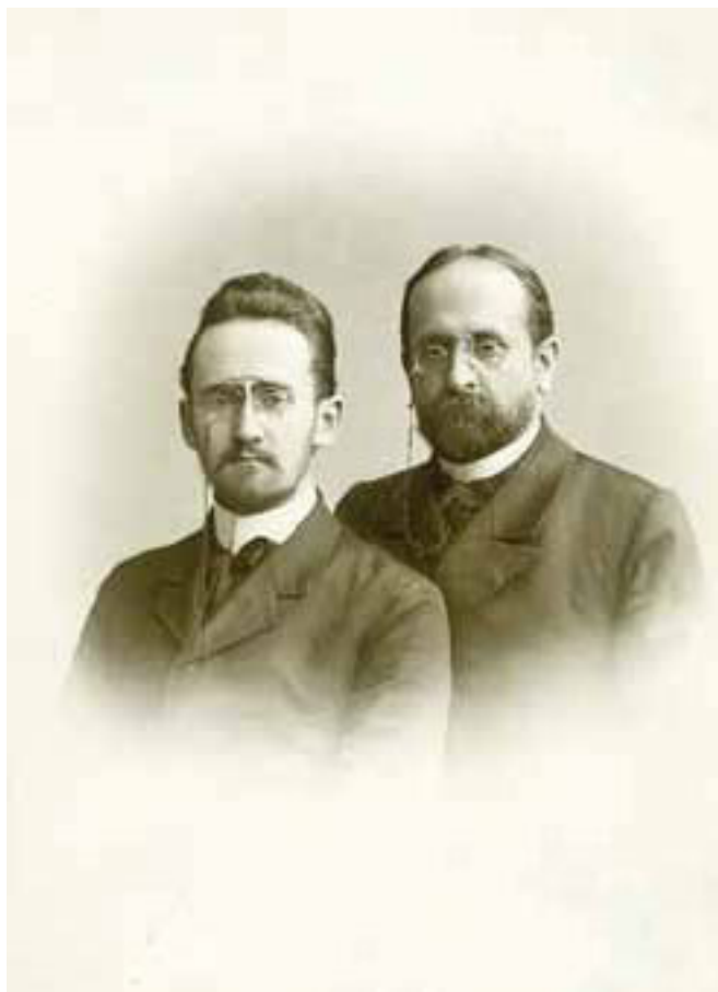
Академик-востоковед Сергей Фёдорович (1863–1934) и Фёдор Фёдорович (1861–1914) Ольденбурги.

Шаховской, Вернадский и Фёдор Ольденбург вскоре стали шутливо называться Шахвербургом – от каждого имени центральных фигур кружка по части. Эти трое были примером добродетели: они не пили вина, не участвовали в студенческих попойках и не вступали в интимную связь с женщинами до свадьбы.