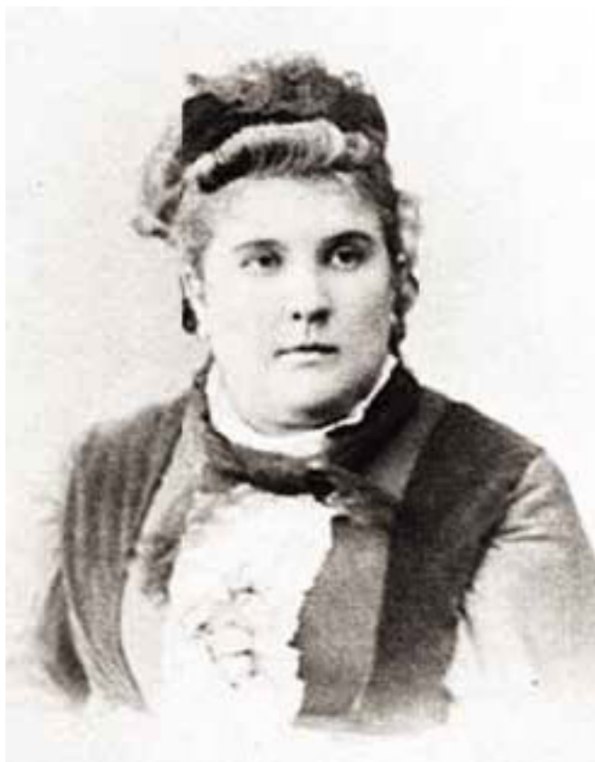
Анна Петровна Константинович, мать Владимира Вернадского.

Через 2 года после смерти жены Иван Вернадский женился на Анне Петровне Константинович, приходившейся кузиной покойной Марии. Анна Петровна родила мужу троих детей: Владимира и двух девочек.