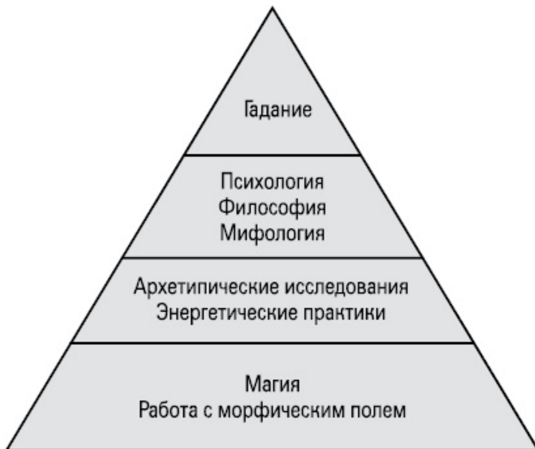
Пирамида практики Таро ( по идее Татьяны Матвеевко )

Вершину этой пирамиды – гадание – можно сравнить с частью айсберга, которая видна над водой. Действительно, на вопрос «Что такое Таро?» большинство ответят: «Это инструмент для предсказаний». Если же мы пойдем глубже, то познакомимся с удивительным сокровищем человеческой культуры, которое хранит в себе мифологические сюжеты, космогонические взгляды, психологическое осмысление действительности.