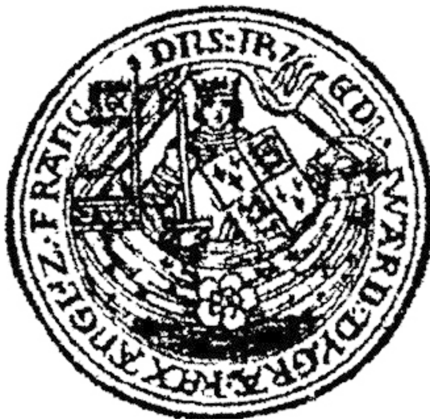
Рис 3. Нобль короля Эдуарда

Монеты из этого металла в свое время находились в обращении, им верили, принимали в оплату. Отличало их лишь одно – алхимические символы, изображенные на них. Такая символика есть на золотых монетах английского короля Эдуарда III (1327–1377). Монета называлась «нобль», что означает «благородный». Считается, что это самая первая известная монета из алхимического металла.