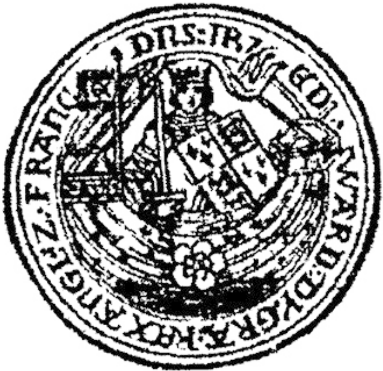
Рис 3. Нобль короля Эдуарда