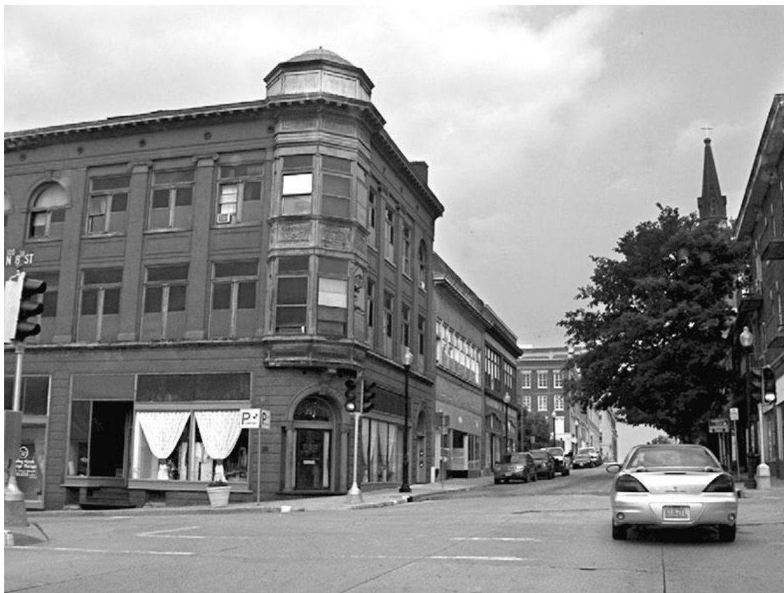
Сент-Джозеф – город в северо-западной части штата Миссури, США. Неформально называется местными жителями – Сент-Джо. Здесь родился Eminem

Нельзя сказать, что Дебби Нельсон страдала серьезным психическим расстройством, но внимания ей требовалось намного больше, чем остальным. Не получая достаточно внимания и жалости, девушка буквально начинала умирать. Ей была необходима новая доза эмоций строго определенного сорта.