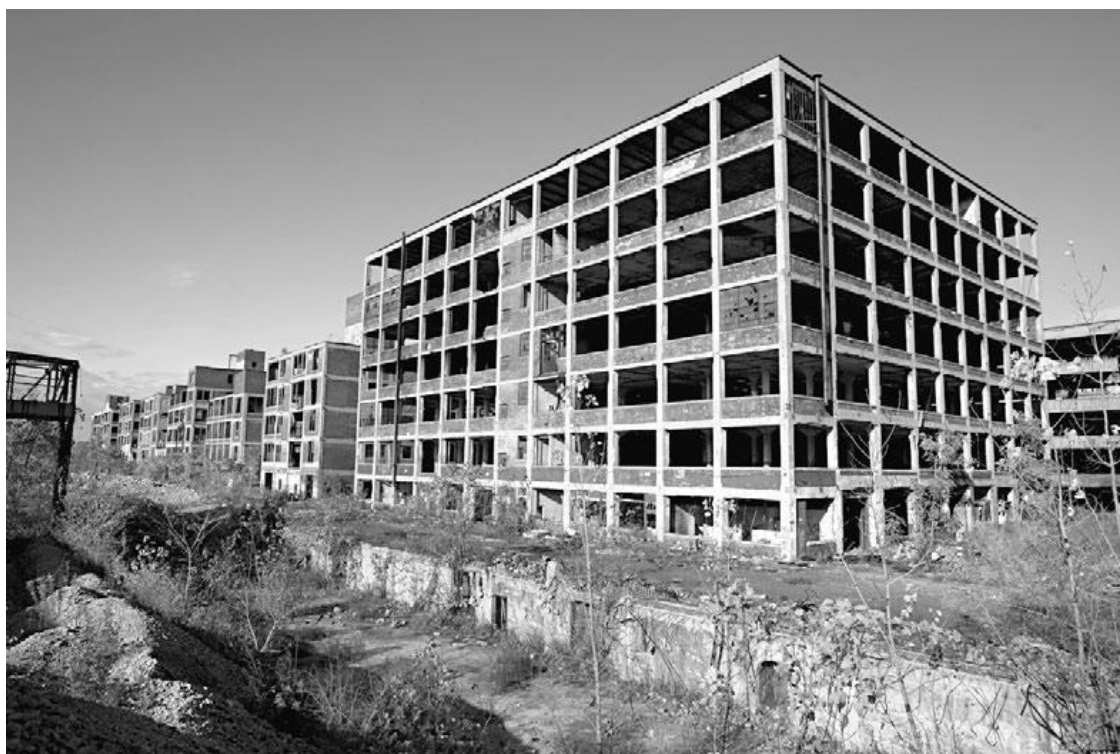
Автомобильный завод Packard. Некогда он был визитной карточкой Детройта

Добро пожаловать в Детройт, самый черный, мрачный и криминальный город США, столицу наркоторговли, убийств, поджогов и насилия. Оказавшись здесь, понимаешь истинное значение слова «безысходность». Именно на этих улицах вырос самый успешный музыкант тысячелетия, рэпер, прославившийся под именем Eminem. Вот уже более пяти десятилетий этот город называют проклятым. Все, кому посчастливилось окончить среднюю школу и не подсесть на наркотики, стараются поскорее уехать отсюда. Впрочем, счастливчики слишком рано радуются. Большинство из них так и не решаются покинуть этот город. Ну а многие вернутся. Причем не на роскошном лимузине и в дорогом костюме, чтобы утереть нос всем, кто насмехался над ними. Нет. Большинство возвращаются сюда, чтобы устроиться на работу в закусочной или супермаркете, а затем благополучно потерять работу и пополнить ряды безработных Детройта. По статистике, каждый пятый житель здесь живет на пособие, а каждый десятый – преступник. По ощущениям, статистика явно занижена.