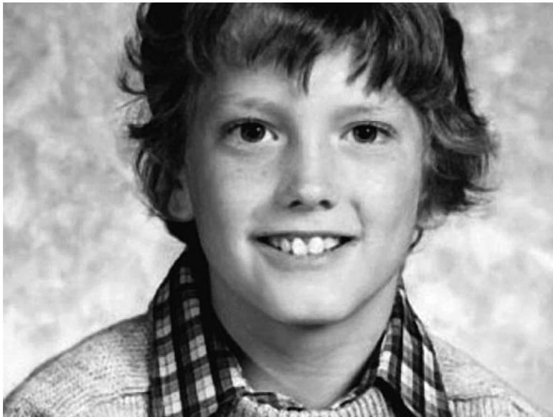
Eminem в детстве