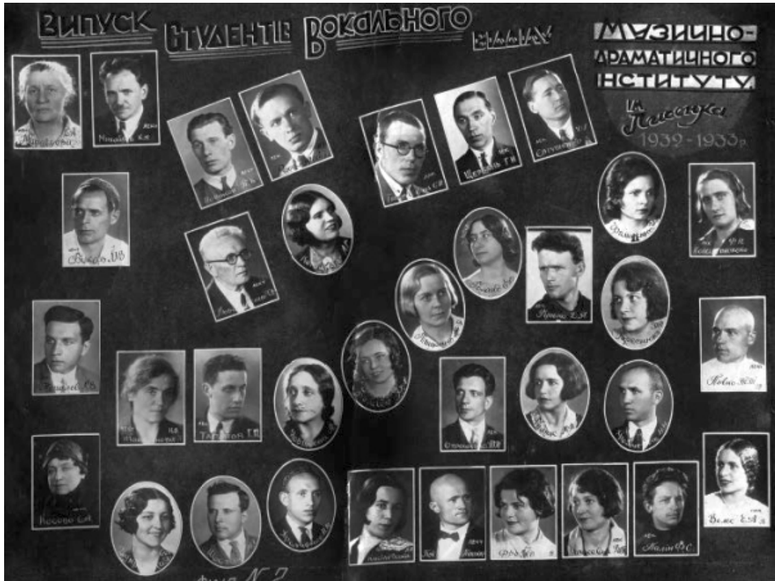
Выпускники 1932-го: четвёртый внизу слева старший брат, во втором ряду справа брат младший