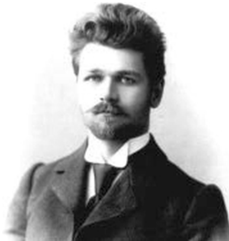
С. Т. Шацкий

Оказалось, можно и даже замечательно, для чего надо было не ударить в грязь лицом перед приёмной комиссией: вступительный экзамен украинская квота на места в аспирантуре не отменяла. А входили в комиссию композитор Михаил Ипполитов-Иванов, профессор вокала Ксения Дорлиак, директор консерватории профессор Станислав Шацкий, от этих и других имён – Александр Гольденвейзер, Константин Игумнов... дух захватывало, зато, как спустя полвека вспоминал отец, «такому составу можно было, не задумываясь, доверить свою судьбу и любое решение принять как должное» (рукопись).