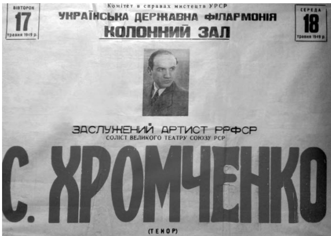
Афиша концерта, 1949 г.