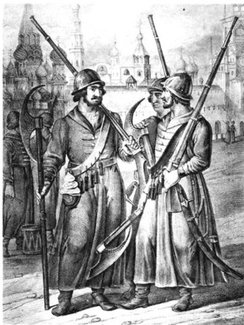
СТРЕЛЬЦЫ в 1618 г.

И еще. На земле Луговой сотни, под Дедиловым, в XVI в. была обнаружена руда, вот ее начали копать и железо из неё варить. Дедиловские кузнецы из воинских людей, стали из того железа себе оружие делать, вплоть до самопалов. И в 1595 г. сын Ивана Грозного – царь Фёдор Иоанович переселил 30 семей тех Дедиловских самопальных кузнецов в Тулу и образовал там Кузнечную слободу, которая потом стала Оружейной. Вот так начиналось Тульское оружие. Если есть время и желание, то сравните сами фамилии Дедиловских воинских людей 16 века и Тульских мастеровых первой половины 17, я специально привел его полностью. И многие знатные тульские оружейники носят дедиловские казачьи фамилии: Мосоловы, Лялины, Крапивенцевы и т.д. А Смоленские казаки получали деньги на поселение и постройку дворов в Туле.