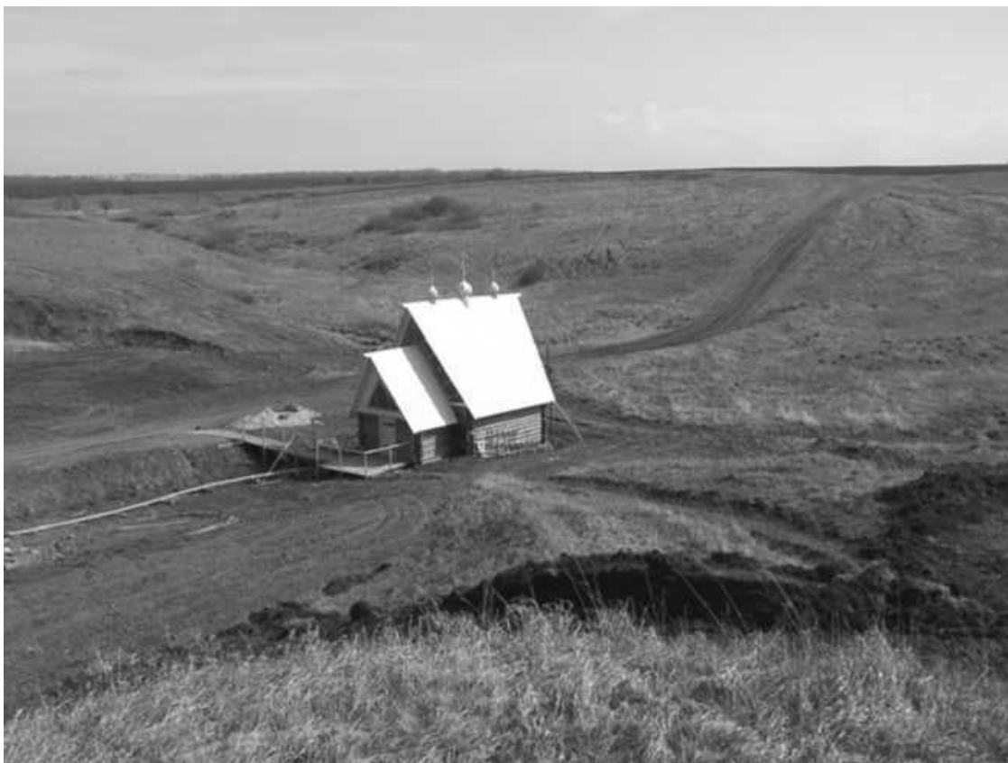
Дедилово. Святой ключ на реке Троена

Археологические находки там датированы V в. до н.э. (попадают греческие монеты III в. до н.э.), X-XII вв. н.э., ну и начиная с XVI в. Церковь Покрова Пресвяты Богородицы снесли еще в XVIII в., а название и разоренная могила остались. А на месте битвы была поставлена церковь во имя Св. Муч. Праскевы нарекомые Пятницы, она и сейчас стоит. И была та церковь приходской Луговой казачьей полуторасотни. Над братской могилой наших погибших воинов была поставлена церковь Покрова Пресвяты