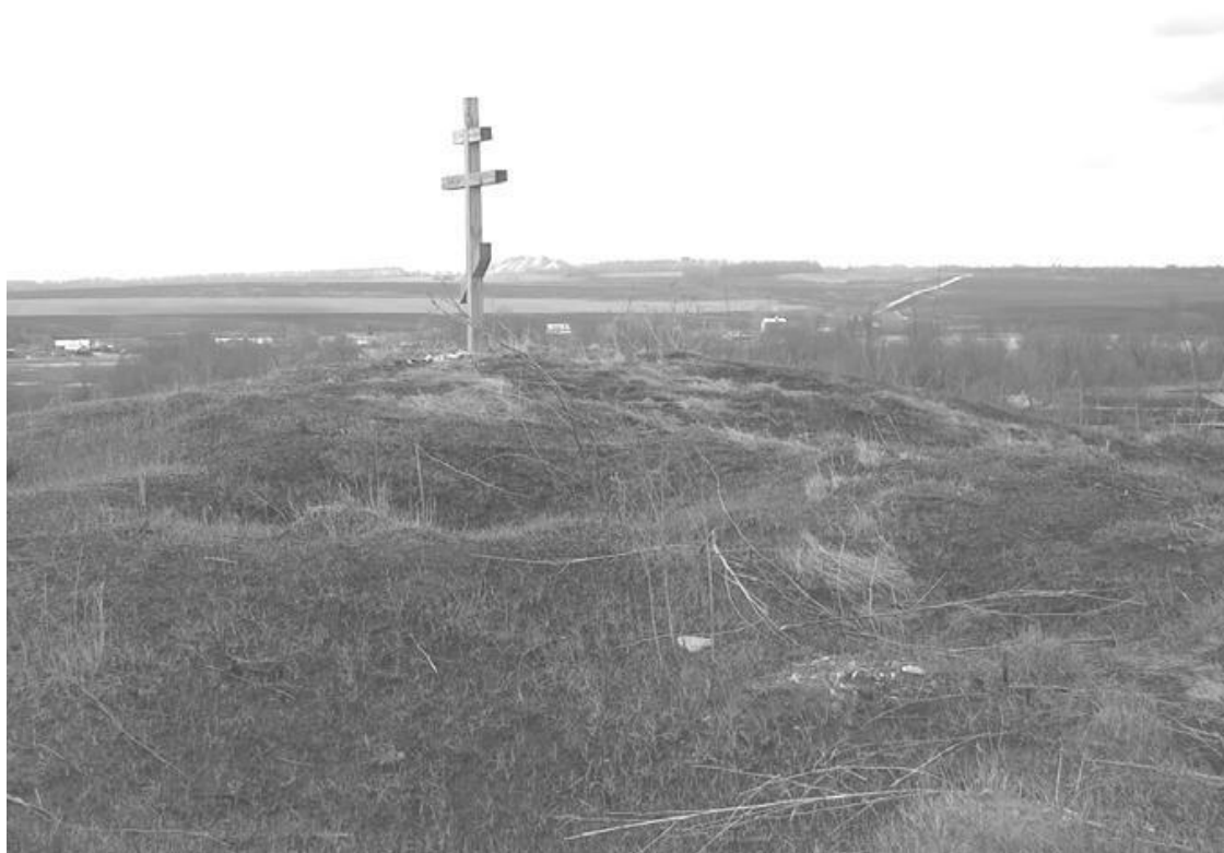
Дедилово. Разоренная братская могила 1552 г. на вершине холма Покровка.

На слиянии рек есть холм, называют его Оленка, здесь до 1932 г. на церковные праздники народные гулянья были, а на другом берегу Олени в поле высокий курган был насыпан. А рядом ещё священное место – Ямские кусты, там на поверхность выход известняка, и в нем нашли скелет со связанными витым медным браслетом руками и тоже до 32 года по занным витым медным браслетом руками и тоже до 32 года по большим праздникам тут проходили народные гуляния. А рядом, в поле находится Святой ключ, Святым он был показан и на картах XVIII в. На северном берегу тоже есть высокий холм, сейчас он Покровкой называется. Когда летом 1552 г. наша кавалерия настигла тут войска крымских татар, которые от Тулы отступали, то два с половиной часа была тут битва. После этого своих погибших товарищей похоронили на вершине высокого холма и рядом поставили церковь Покрова Пресвятыя Богородицы. И у того кургана кости наших воинов валяются. Находили там и анкалпионы – кресты нательные, которые казаки до XVI в. носили, и косы волос человеческих сантиметров по 30 – это братья наши Запорожские свои хохлы, т. е. чубы в косы заплетали, но потом мода изменилась.