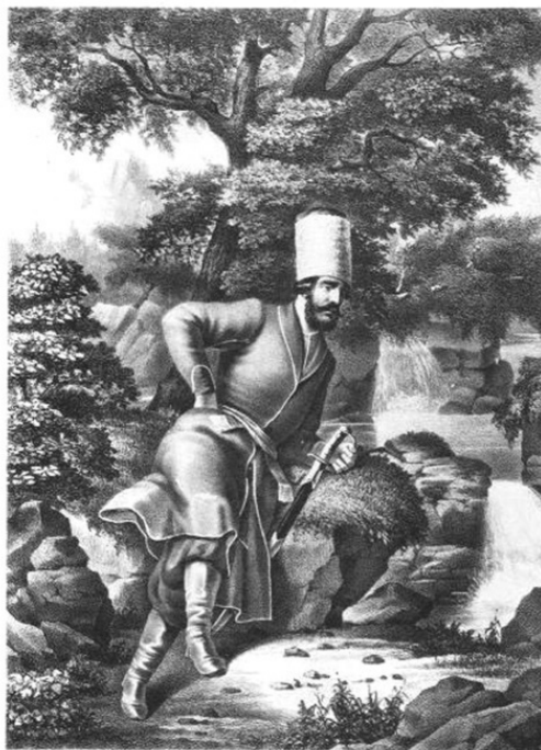
ДОНСКОЙ КАЗАК 1774 г.