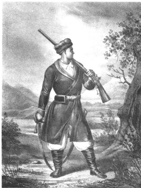
МАЛОРОССИЙСКИЙ КАЗАК XVII век.

сторожевая служба служить, и тем поместная придача и денежное жалование давати.» (4. стр. 29-30) . Вот так, не справился с обязанностями -вертай назад дворянский чин и снова в рядовые казаки. А там поместья уже нет, и живешь с земляного пая, но и на Государевой службе 3 месяца, а Сторожевой казак – полгода, и вот, чтобы ему с хозяйством легче было управляться, разрешалось иметь один крестьянский двор в помощь. Когда в XVIII в. с мелкопоместным дворянством покончили, то все служилые дворяне, и Сторожевые казаки, и Дети боярские потеряли много прав и стали однодворцами, хотя по старой памяти их в Гвардейские полки, где служили только дворяне, на службу брали.