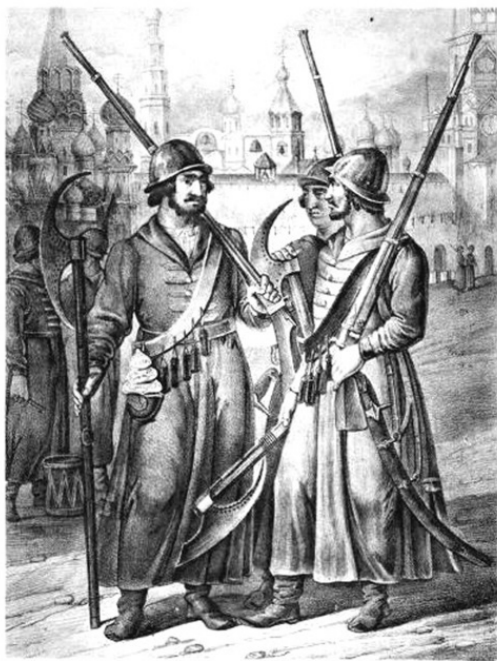
СТРЕЛЬЦЫ в 1618 г.

ли есть время и желание, то сравните сами фамилии Дедиловских воинских людей 16 века и Тульских мастеровых первой половины 17, я специально привел его полностью. И многие знатные тульские оружейники носят дедиловские казачьи фамилии: Мосоловы, Лялины, Крапивенцевы и т.д. А Смоленские казаки получали деньги на поселение и постройку дворов в Туле.