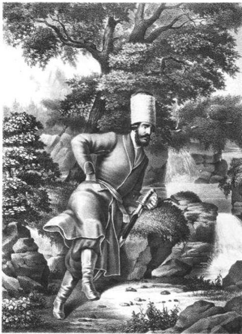
ДОНСКОЙ КАЗАК 1774 г.

Цель одна – раздробить Россию и стравить эти части между собой, ЕДИНАЯ и НЕДЕЛИМАЯ она слишком ОПАСНА для Великого Рейха и других наших «друзей». Противостояние слишком дорого стоит и всегда заканчивалось разгромом, а так – пусть дерутся между собой, а потом мы придем и их «помирим», когда они совсем ослабнут и будут все