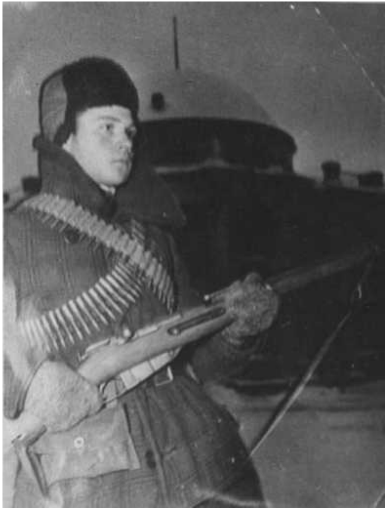
Боец Тульского истребительного батальона, комсомолец