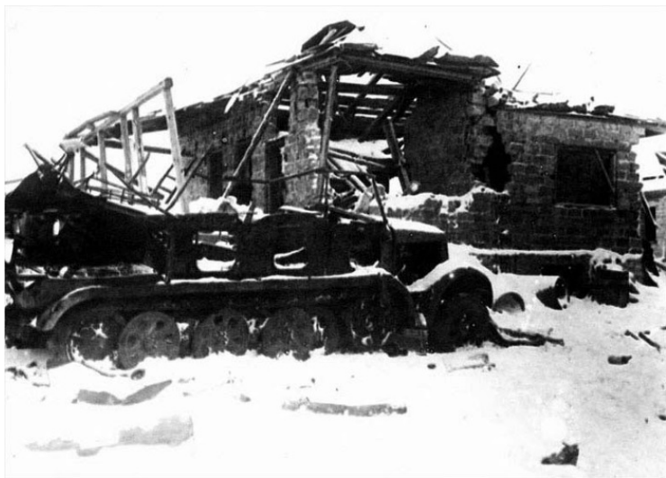
В освобожденном поселке Косая Гора

14.11.41 г. 217 сд с 58 зап. полком и ротой 151 пап обороняла: свх. Мясново, выс. 198, 1, Михалково, Ниж. Китаевка, Верх. Китаевка. Противник в 8.30 силою 10 танков, до роты пехоты вел наступление со стороны Маслово на юго-зап. окраину Тула. Атака противника – отбита.