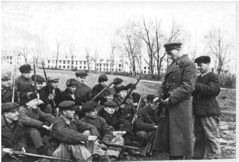
Лейтенант НКВД обучает бойцов истребительного батальона обращению с оружием. Тула 1941