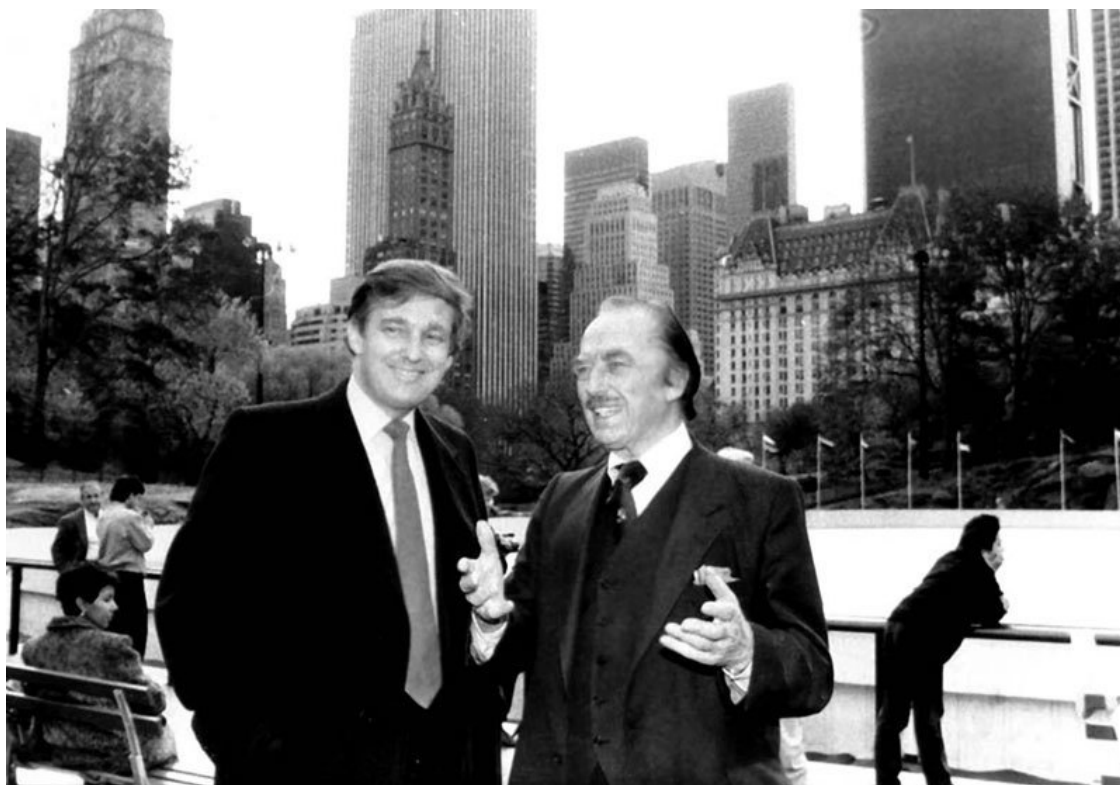
Строительные магнаты. Дональд и Фред Трампы

История семьи Трамп начинается в 1885 году, когда Фредерик Трамп (14.03.1869 – 30.03.1918), дед Дональда, оставив винодельческий бизнес, переехал из Германии в Соединенные Штаты, город Нью-Джерси. В 1905 году родился отец Дональда – Фред Крест Трамп (11.10.1905 – 25.06.1999).