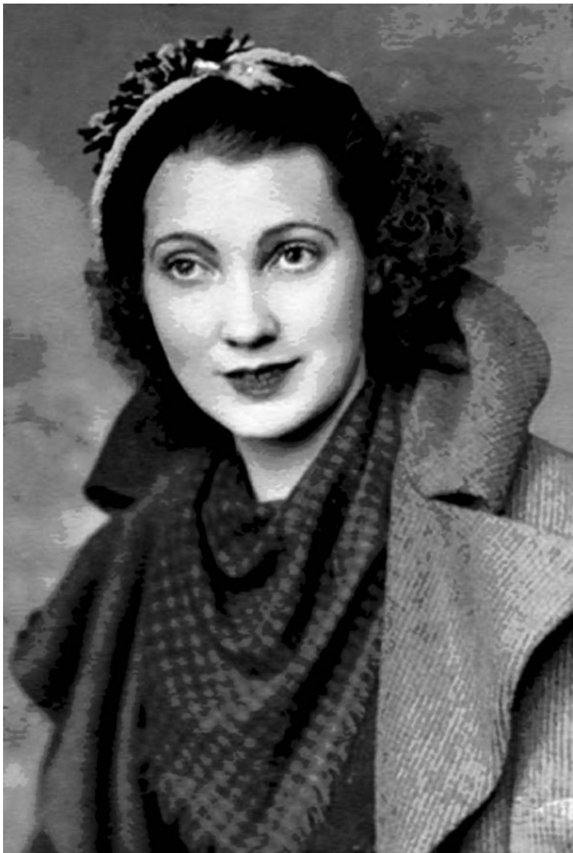
Мать Дональда Трампа, Мэри Энн Маклеод Трамп