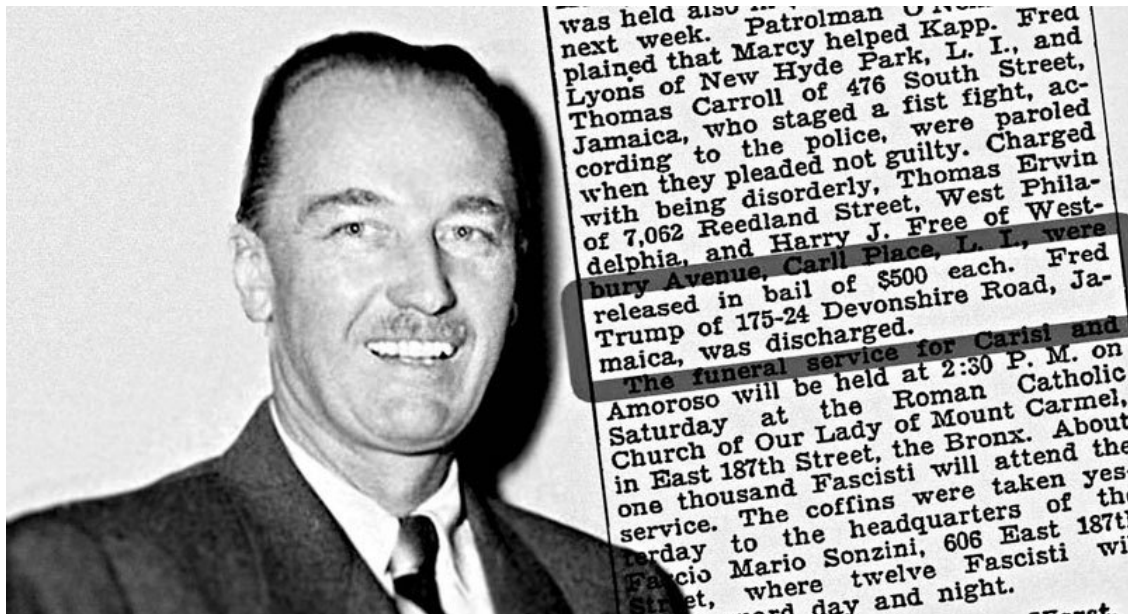
1927 г. Фред Трамп арестован за драку с полицейскими