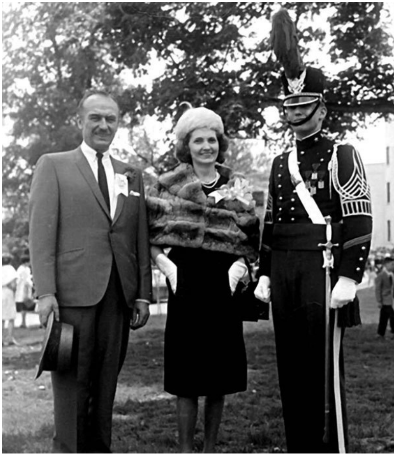
Дональд Трамп со своими родителями Фред и Мэри

Имея такие убедительные преимущества, Фред Трамп зачастую придерживался следующей тактики. Он начинал