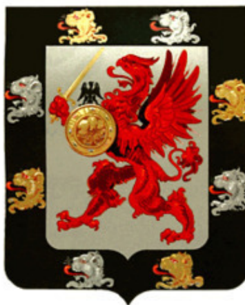
Герб рода Романовых