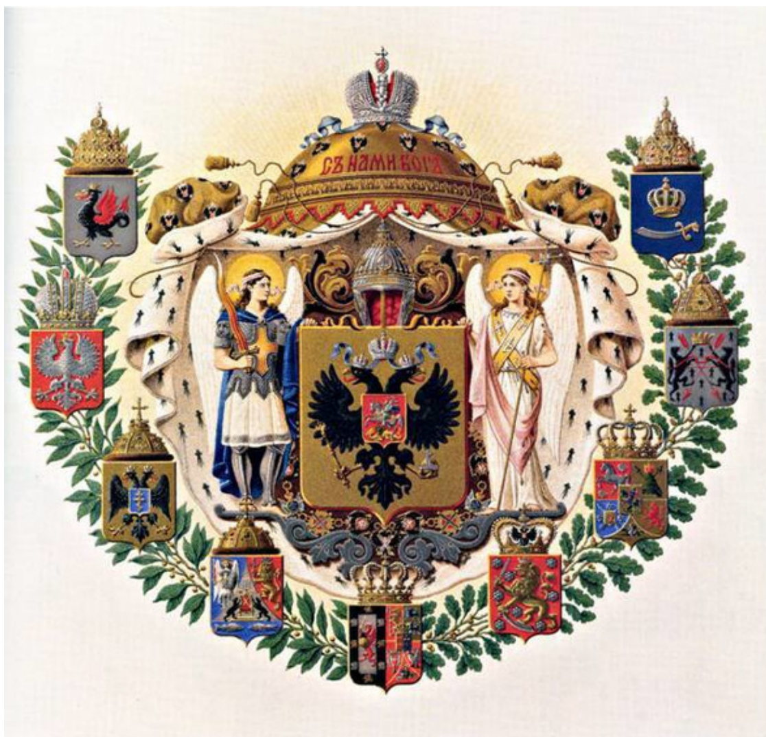
Большой герб его императорского высочества государя наследника цесаревича Алексея Николаевича.