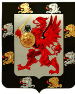
Герб рода Романовых