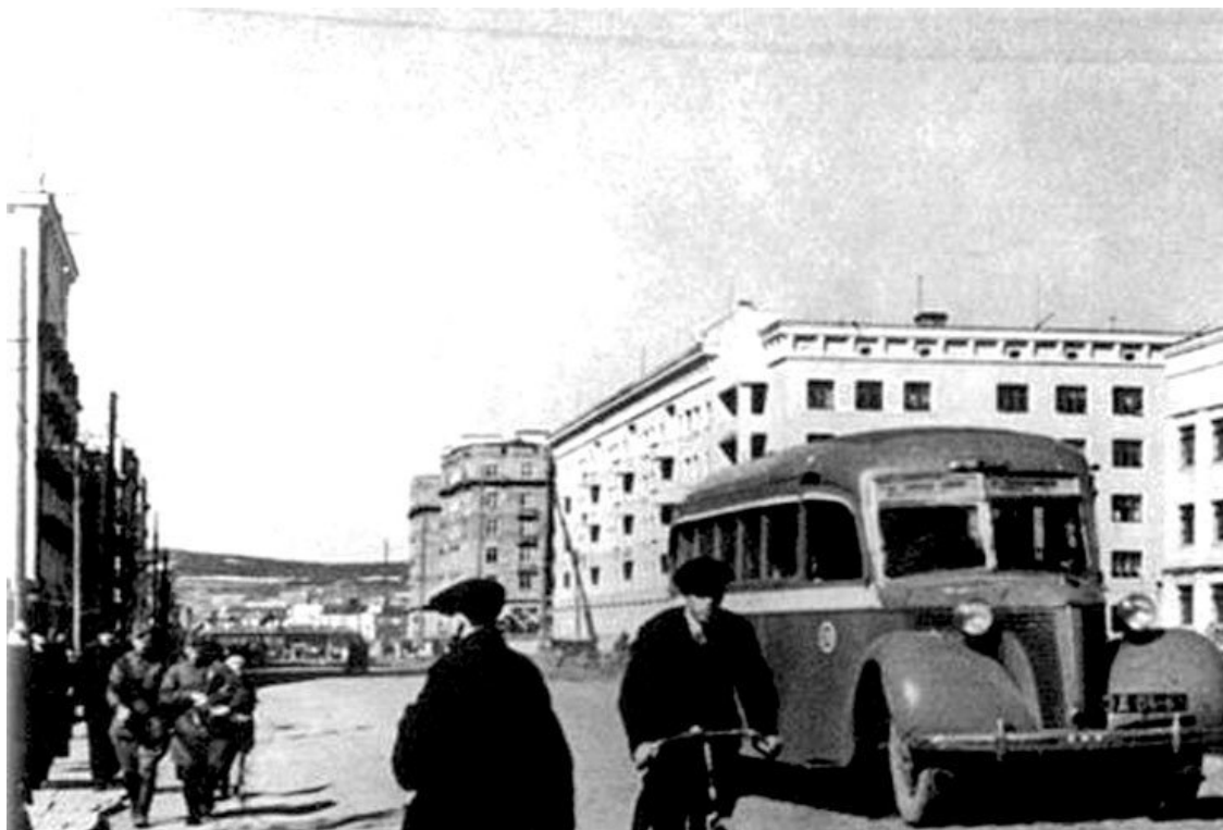
Улица Сталина. Мурманск. Начало июля 1941 года