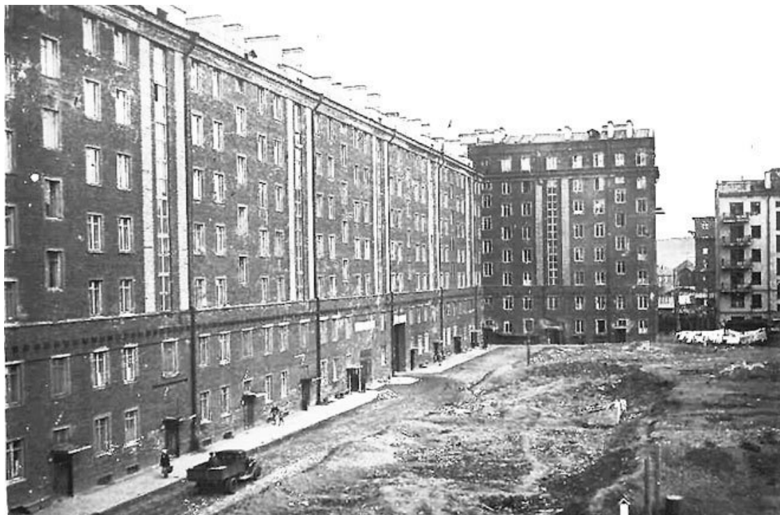
Наш двор между домами, стоящими по улицам Сталина и Самойловича

Железнодорожная связь с Мурманском была восстановлена только в конце ноября – начале декабря 1941 года, по окончании постройки ветки, соединяющей станцию Обозерская (трасса Москва – Архангельск) со станцией Беломорск (трасса Мурманск – Ленинград). После этого Кировская (Мурманская) железная дорога, имевшая большое стратегическое значение для связи Заполярья с центром страны, начала бесперебойно функционировать через Вологду (Мурманск – Кандалакша – Беломорск – Обозерская – Вологда).