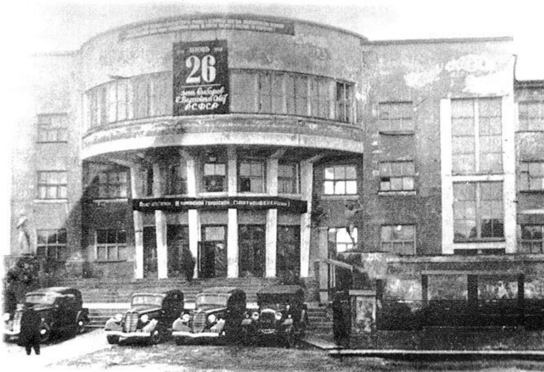
Здание Дома культуры им. Кирова