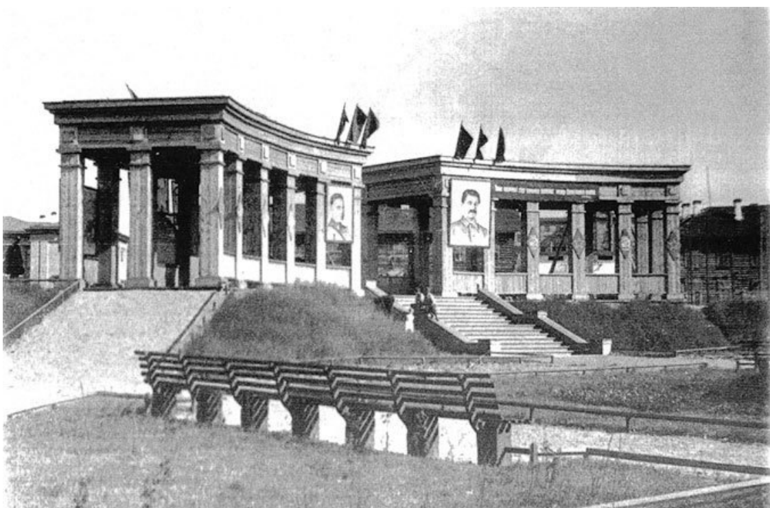
Сквер у Дома культуры им. Кирова