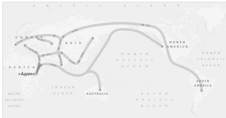
ПУТИ МИГРАЦИИ ПЕРВЫХ ЛЮДЕЙ

M 168: 50,000 лет назад M 9: 40,000 лет назад M 173: 30,000 лет назад M 3: 10,000 лет назад M 122: 10,000 лет назад M 130: 50,000 лет назад M 175: 35,000 лет назад M 20: 30,000 лет назад M 172: 10,000 лет назад M 89: 45,000 лет назад M 45: 35,000 лет назад M 242: 20,000 лет назад M 17: 10,000 лет назад