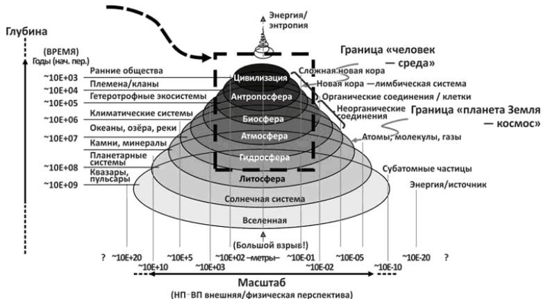
Рис. 1.1. Краткая история мира.

Города, расположенные в различных географических зонах, возникли в ходе решения одних и тех же сутевых проблем разными способами. Мы обманываемся, если думаем, что сущностные услуги, предоставляемые городом, можно прочесть в перечне от любой мэрии: землепользование, водоснабжение, утилизация отходов (твёрдых и жидких), транспорт, строительство. Но лишь немногие администрации задаются вопросом о жизненно важных, но «не входящих в перечень» услугах, таких как снабжение пищей и энергией, распределение и менеджмент, здравоохранение и образование. В западном мире (с его демократическими, капиталистическими или смешанными экономиками) эти функции, по крайней мере, оставлены частному сектору. А в раз-