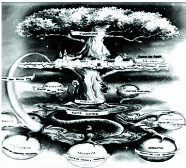
Рис. 3. Иггдрасиль, мифическое дерево между мирами (Википедия)

мирами представляет собой нечто такое, что мы можем развивать в самих себе.