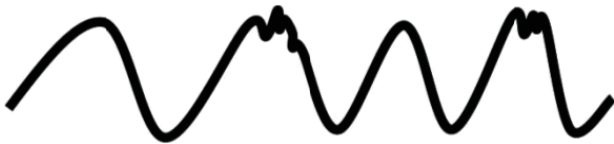
Рис. 4. Наши движения плавные и немного непредсказуемые

себе просто быть движимым пространством, вот как это выглядит ( Арни медленно передвигается, затем слегка дергается ). У каждого из вас будет свой собственный опыт пространства и движения в нем. Некоторые люди будут стоять на месте. Но в данный момент быть движимым пространством для меня означает, что я более или менее перемещаюсь туда-сюда – более или менее и о-о-о , время от времени есть также небольшое подергивание и вдобавок может быть еще что-то. Пожалуй, я нарисую это движение на доске.