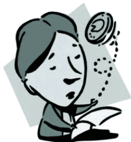
Рис. 5. Спіраль в повітрі зображає рухомих нас сили «пространственно-временного сновидения» – суміші тяготе́ння, сновидения і Дао, що стоїть за подіями

ывається на безумовному переконанні, що сила пространства-времени, Дао, впливає на підбрасувану монету. Ейнштейн називав поле тяготе́ння, або пространство вокруг нас, пространством-временем . Це наша общая позиция . Ця загальна позиція – єдине пространство, в якому ми можемо говорити про існуючу різноманітність, не вступаючи в війну. Достиження цього пространства і течія важко для фасилітаторів.