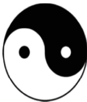
Рис. 2. Инь – Ян

энергия процессуального ума движется между полярными противоположностями. Дао, которое можно выразить словами, – это инь и/или ян действительно просто и легко. Дао, выразимое словами – это то, что происходит, если я прошу Дао сказать мне, следует ли мне идти налево или направо. Это похоже на то, как я подбрасываю в воздух свою ручку. Следует ли мне идти в жизни направо или налево? Позвольте мне теперь подбросить ручку, чтобы она крутилась в воздухе ( подбрасывает ручку ). Она говорит – налево. Налево! Это Дао, которое можно выразить словами.