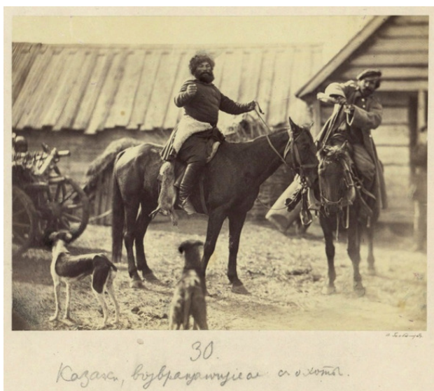
Возвращение с охоты