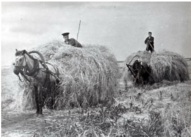
Казаки на сенокосе.

Ячмень, пожалуй самый неприхотливый злак, как в отношении почвы, так и климата. Посеянный ранней весной ячмень переносил всевозможные невзгоды, как заморозки, жара и недостаток влаги. Но как и рожь, казаки весной сеяли ячмень не вспахивая зябь, под борону.