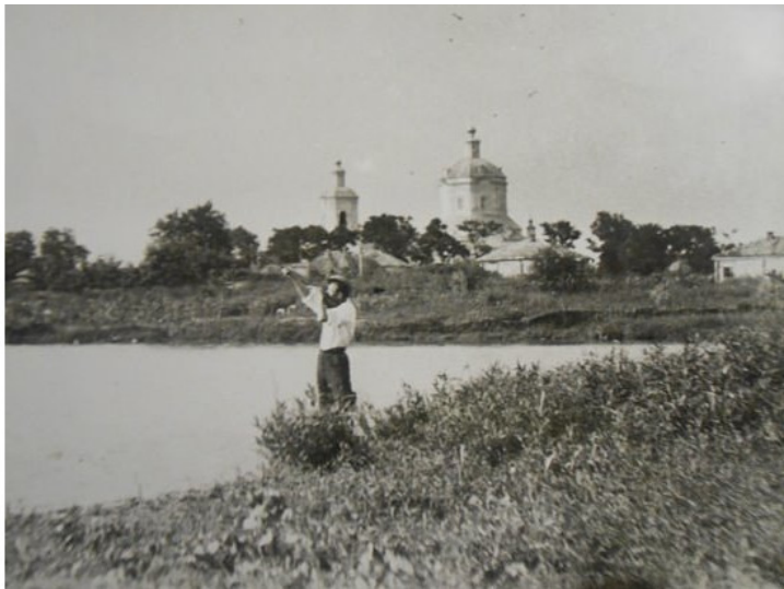
Вид на церковь ст. Митякинской.

Впоследствии юрт несколько раз перемежёвывался. Так при межевании 1884 – 1885 года, площадь юрта сократилась и составила 135848 десятин и 395 кв. сажен. К юрту как добавлялись, так и отрезались довольно значительные участки земли. Так к Митякинскому юрту был приписан хутор Сибилевский с его землями, ранее входивший в юрт станции Каменской. А так же несколько участков из войсковых запасных земель. Часть земель юрта была отчуждена под крестьянские наделы, а так же под Луганско-Миллеровскую железную дорогу (369 десятин и 861 кв. сажен) и по-