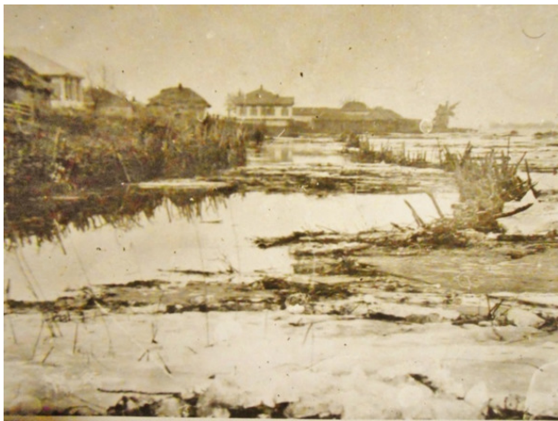
Весна. Вид на ст. Митякинскую

Сенокосных угодий к началу 20 века в Митякинском юрте так же не хватало. Ещё часть земель находилась в станичном резерве. Один из таких участков располагался в урочище Золотое Руно, выше хутора Средне-Митякинского.