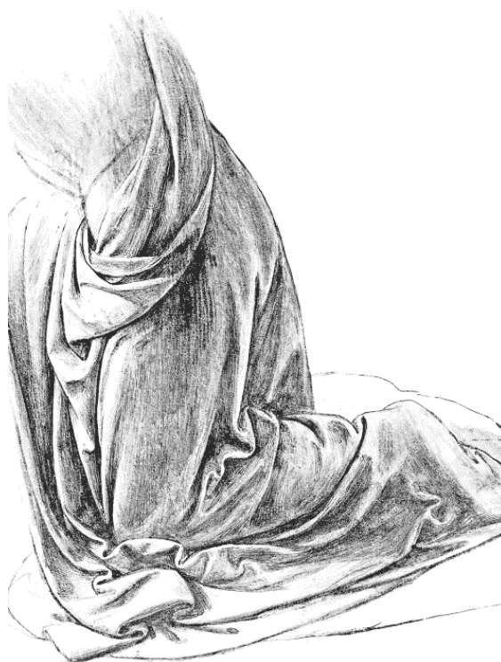
Драпировка на коленях, 1491–1494 гг.

За отсутствием картин рассмотрим сначала некоторые рисунки, проекты не известных нам произведений, образы, вокруг которых хоть временно витала фантазия художника. На одном рисунке (Виндзорские эскизы) Богородица опирается левым коленом на землю, а на ее правом приподнятом колене сидит сын, обеими руками держит перси матери и прижимает их к губам, подняв глаза к матери; с правой стороны выступает св. Иоанн в восторженном порыве, со сложенными руками; на другом рисунке Богородица стоит на коленях; она открывает объятия, а ребенок, лежащий на подушке, протягивает ей ручки (Виндзор). На одном эскизе (Уффици) Богородица стоит и, улыбаясь, глядит на сына, которого она поддерживает; он сидит на небольшом круглом столике и придвигает маленькую кошечку, которая пытается убежать. Но вот еще более фамильярная сцена: Пречистая Дева полулежит на земле, правая нога ее вытянута, а левая перекинута через нее; с какой-то неопределенной задумчивостью глядит она на Иисуса, который, распростершись на ней, прижимает головку к ее груди и рученьками ласкает материнские перси; левой рукой Богородица облокачивается на очень низкую скамейку, по которой св. Иоанн изо всех сил старается пододвинуть к нему маленькую кошечку 8 . На таком великом произведении, как Луврская «Св. Анна», мы можем убедиться в удаче его попытки сочетать бессознательную грацию ребенка и животного.