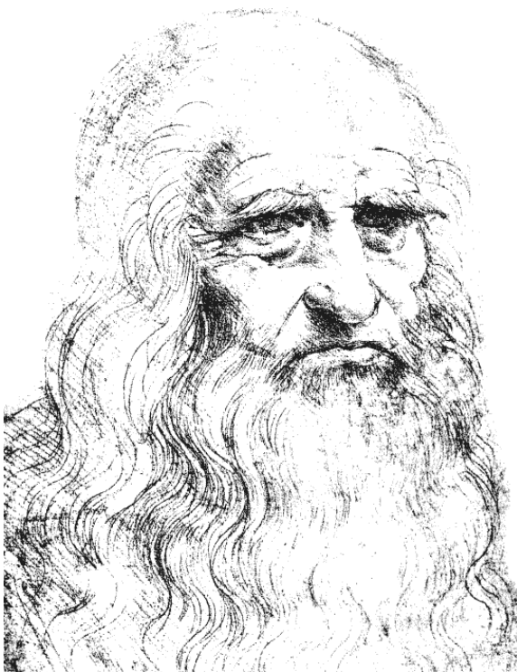
Леонардо да Винчи (1452–1519) Туринский автопортрет, после 1512 г.

III. Предание о Пречистой Деве: Мадонны Леонардо. – Мадонна Литта (Эрмитаж, С.-Петербург). – Картина La Vierge aux Rochers («Пречистая Дева в горной дебри», Лувр, Национальная галерея в Лондоне). – Влияние на Рафаэля. – «Поклонение волхвов»: этюды и окончательный эскиз. – Характер живописи Леонардо. – Скульптура: барельеф «Раздор» (Кенсингтонский музей).