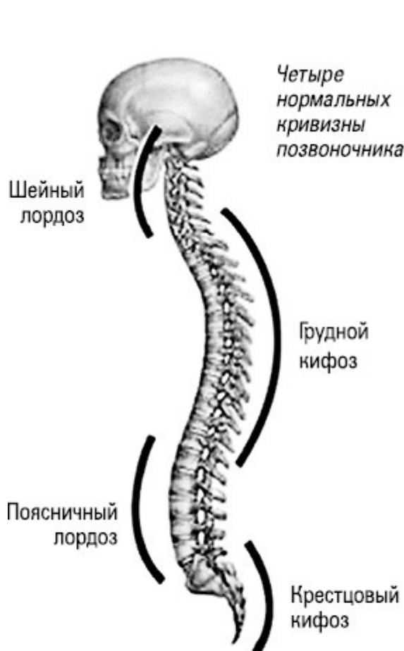
Рис. 1. Четыре изгиба позвоночника