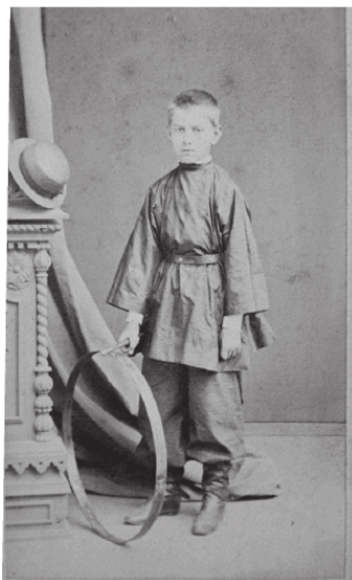
В.П. Сербский в детстве

Петр Яковлевич Сербский был женат на Юлии Васильевой, от брака имел дочь Надежду, 7 августа 1854 года рождения, и двух сыновей Владимира, родившегося 14 февраля 1858 и Сергея, родившегося 16 мая 1863 г. За женой его в Богородске числился деревянный дом. В 1874 году Петр Яковлевич вместе с детьми был внесен в третью часть дворянской книги.