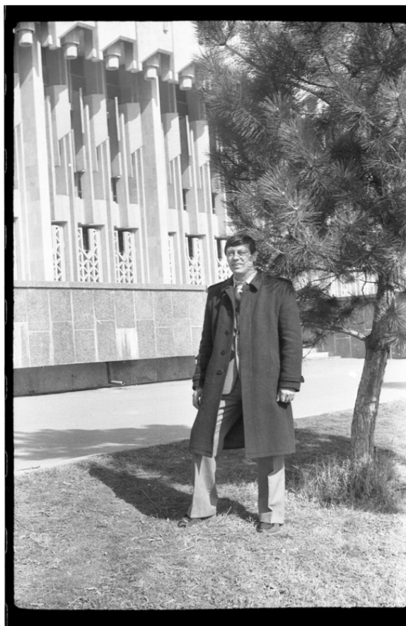
Это Я. г. Ташкент. 1990 год.