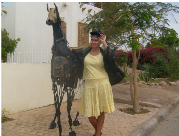
Египет. Шарм – ель-Шейх. Туристка. 2009 год.

– Если присвоили 3 —й разряд, то оправдывай его.