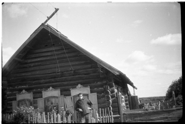
Это я у дома в деревне Каменно – Озеро. 1968 год.