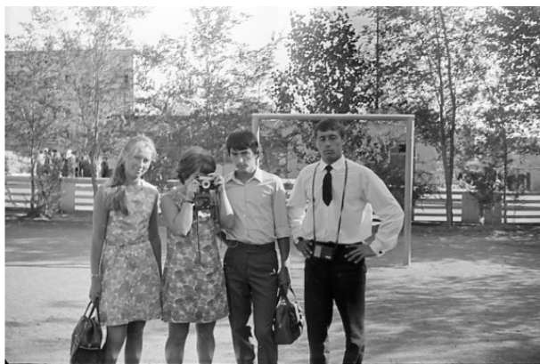
г. Балхаш. Я со студентами на практике. 1972 год.

Станция Моинты представляла собой захолустье. Здание станции небольшое строение, тут же столовая, где мы пообедали. Здесь мы попробовали казахское блюда манты, очень вкусно, это по-уральски большой пельмень. В стаканах продавали кумыс, кислый на вкус. Говорят полезный напиток, имеет градусы. Вокруг станции полупустыня и перекасти поле, которые катятся в даль по ветру. С десятка два строений с хозяйскими постройками. Это мазанки, построены из глины и навоза, сверху крыш торчат трубы, из некоторых валил серый дым. По степи бродят небольшие стада овец и коз, имеются и коровы, да несколько верблюдов. Для нас верблюды на свободе – это в диковинку. Мы их видели только в зоопарке. Мирные животные, корабли пустыни. В глаза бросаются собаки да кошки, которые бродят без присмотра.