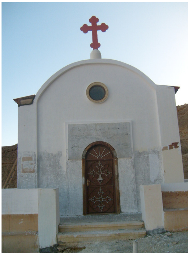
Египет. Часовня святому Великому Антонию. 2008 год.

Один раз получился, забив оборудования в моей смене, в цех поступила руда с длинно – волокнистым асбестом. Циклоны не справлялись с осаждением асбеста и вынос по воздуховодам транспортировался в камеру Батурина. Моя смена работала с 18 до 24 часов ночи. Это случилось в конце смены на участке камеры Батурина. Забились конвейера, соответственно и бункера. Стали пробивать всей сменой человек 10.