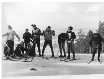
Группа ОПИ – 68 – 2 на лыжах в Уктусе. 1968 год.

Я утром встал рано и по привычке с одним товарищем, на голове у него росли рыжие волосы, решили сделать пробежку по окраине леса. Здесь со мной произошёл инцидент, который запомнился на всю жизнь. А произошло следующее. Бежим мы с товарищем вдоль опушки леса, беседуем на ходу. Видим впереди, рядом с лесом пасётся стадо коров, овец. И вдруг, откуда ни возьмись, выскочила из кустов большая, лохматая, борзая собака, она оскалила острые зубы и стала приближаться ко мне. Мой спутник оказался за спиной у меня. Я испугался и стал пятиться назад, собака за мной. Я приговаривал: