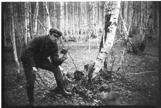
Это я в лесу в деревне Каменно – Озера. 1968 год.

Меня в ней, что – то приворожило. Она выглядела женственно, мне нравилась её причёска, лицо, фигура. Ноги не совсем. Тем не менее, выглядели не плохо.