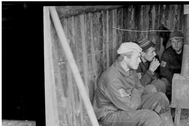
г. Камышлов. Перекур в работе. 1969 год.

Перед Спартакиадой меня назначили физруком отряда. Я старался подбирать ребят на эстафету самых быстрых и выносливых. Формировал команду в волейбол и футбол. Устраивал прикидочные забеги на время.