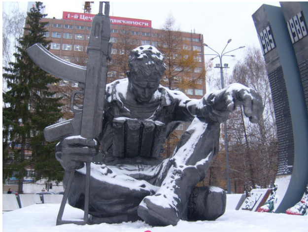
г. Екатеринбург. Памятник Афганцам. 2003 год.

морозы легко одевалась. В прочем, я тоже. На тёплую одежду ещё не заработали. Хотя, после первого строительного отряда я покупал тёплую одежду.