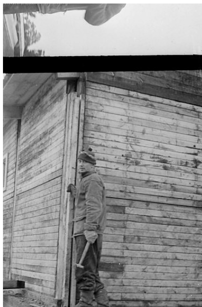
г. Камышлов. Строитель. 1969 год.

Проводилась эстафета, все участники разошлись по этапам. Дали старт. Я помню хорошо, тот энтузиазм, тот задор, молодость, что даёт победу. Мы, Стройотряд «Искатель», выиграли эстафету. Это было здорово! Замечательно! Мы ликовали!