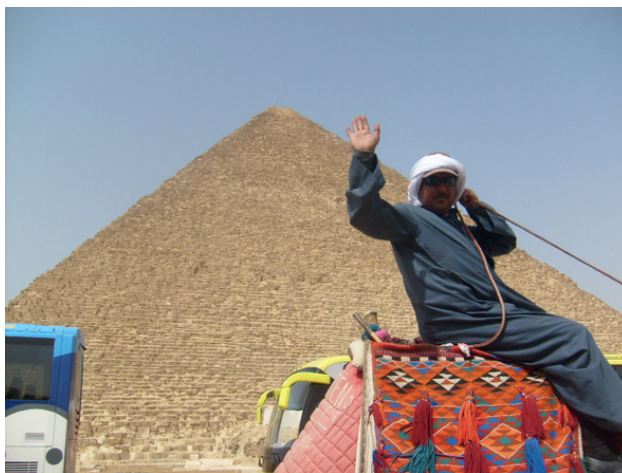
Египет. Гиза. Пирамиды. 2008 год.

Девушки готовили еду и закуски к встрече Нового Года. Все занимались делом. Приблизительно комнату, даже помыли пол. В избе стало тепло, шумно, весело, играла музыка. Настроение у всех студентов было праздничное.