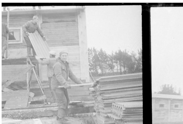
г. Камышлов. Работа кипит на стройке. 1969 год.