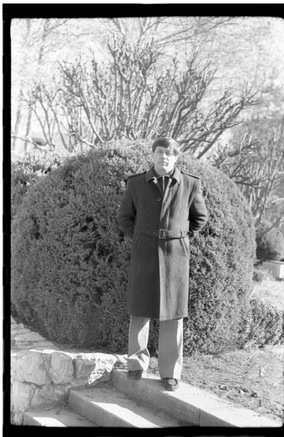
г. Ташкент. Курсы по «Госприёмке». 1990 год.