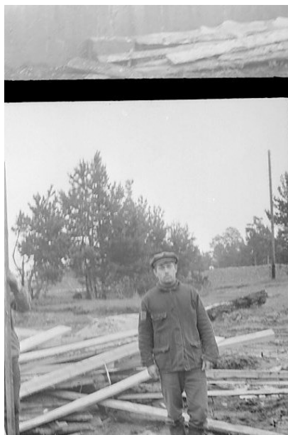
г. Камышлов. Это я. Боец строительного отряда «Искатель». 1969 год.