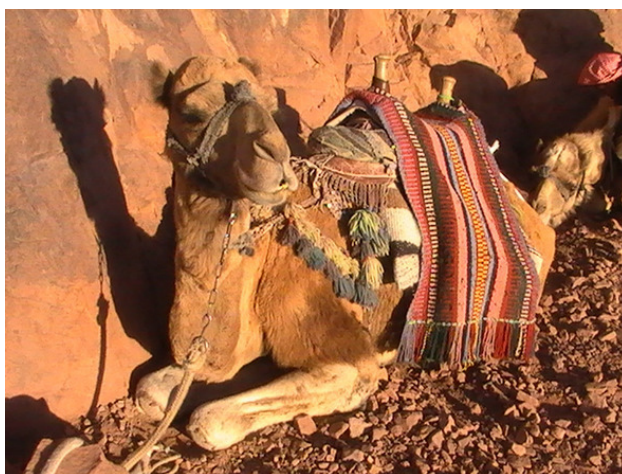
Египет. Отдыхающий верблюд. Дорога на гору Моисея. 2008 год.