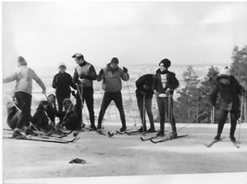
Группа ОПИ – 68 – 2 на лыжах в Уктусе. 1968 год.