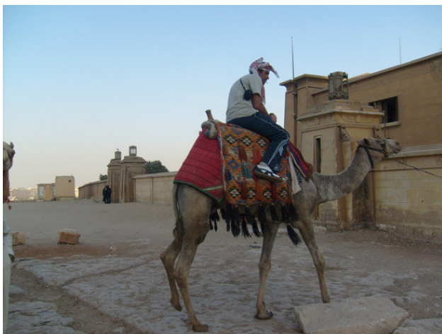
Египет. Гиза. На дороге к Пирамидам. 2008 год.

Время пролетело до утра быстро, многие легли отдыхать Кто – то разбился по парочкам на полатах, на печке и других укромных местах. Целовались и обнимались.