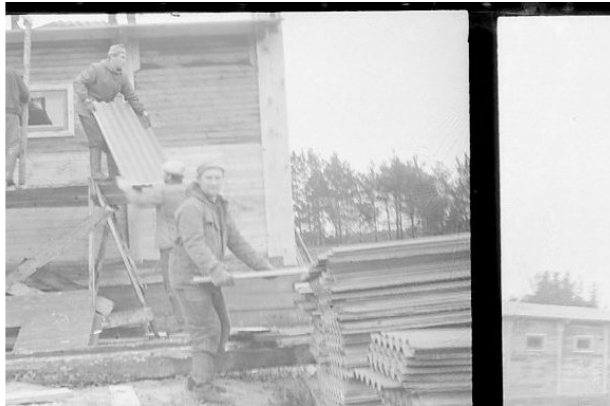
г. Камышлов. Работа кипит на стройке. 1969 год.