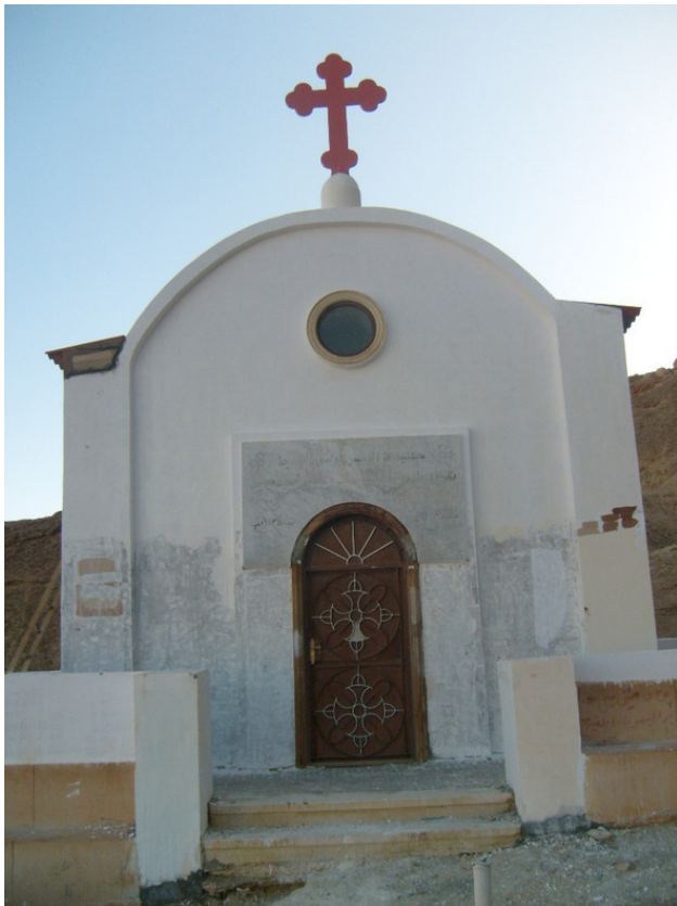
Египет. Часовня святому Великому Антонию. 2008 год.

Один раз получился, забив оборудования в моей сме- не, в цех поступила руда с длинно – волокнистым асбе-