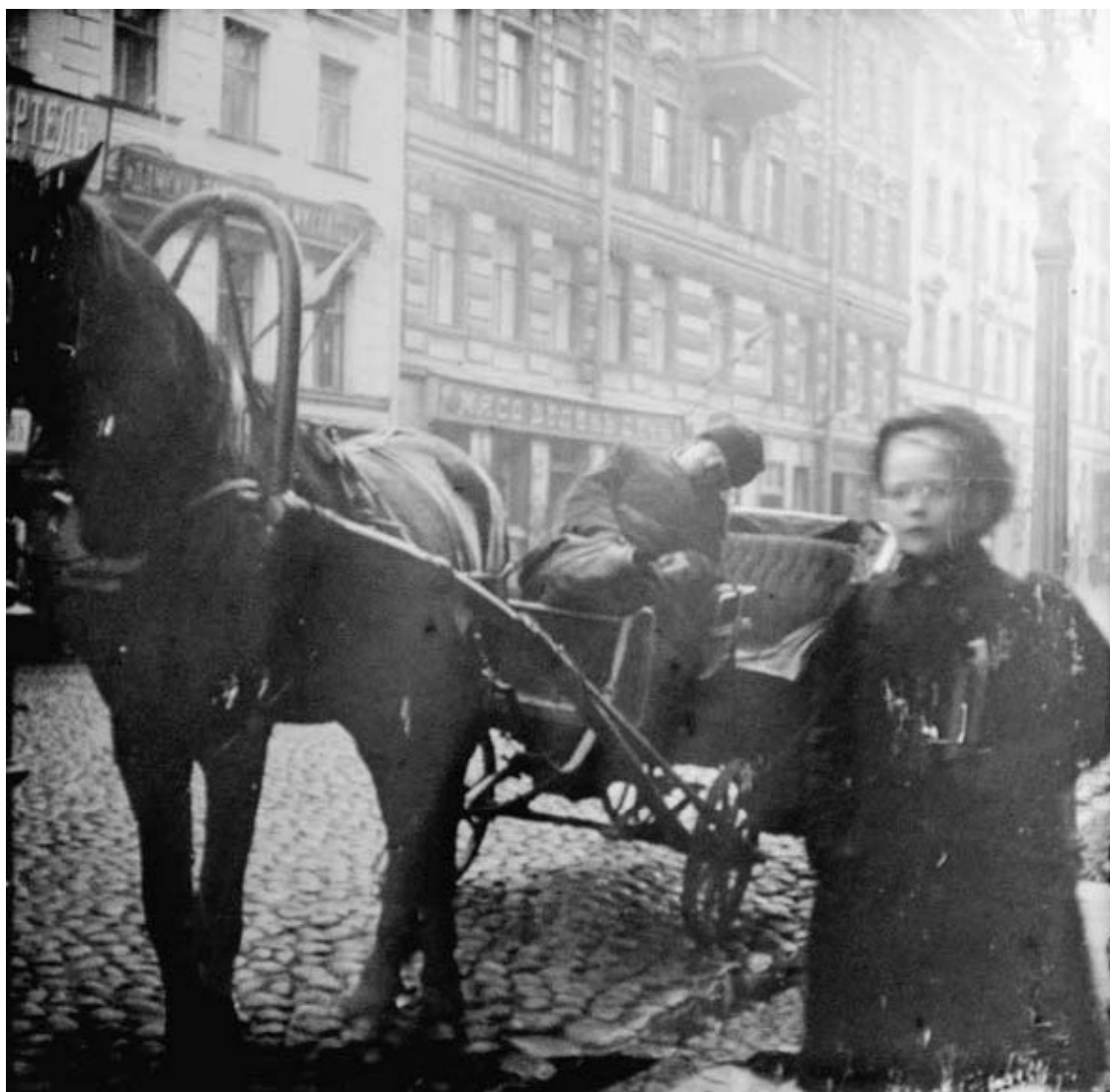
Троицкая улица. 1909 год