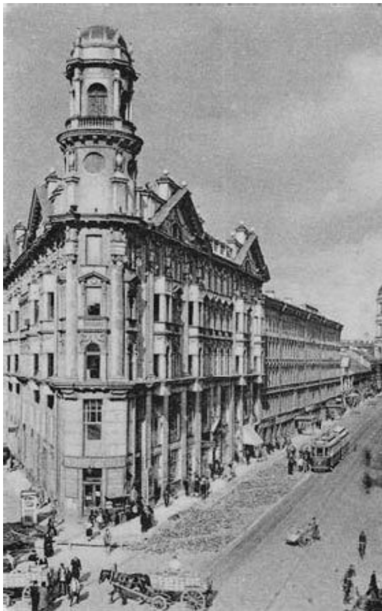
Доходный дом Иоффа у Пяти углов. 1930-е

Надо сказать, в советское время репутация улицы не улучшилась. Предпринимались попытки осовременить ее образ. В 1929 году она была переименована в честь Антона Рубинштейна: без особого смысла, просто чтобы насолить церковникам. Любимец царей, выкрест, композитор Антон Рубинштейн четыре года прожил по адресу: Троицкая улица, 38.