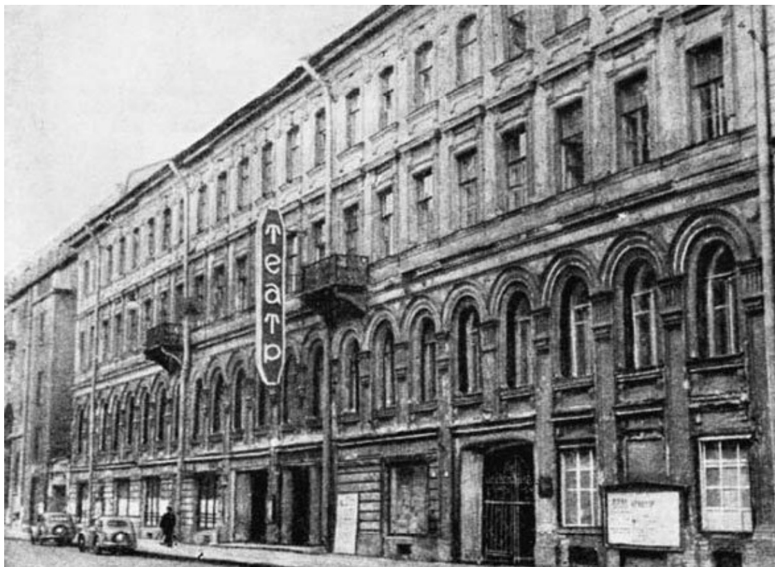
Малый драматический театр. 1950-е.

1960 год