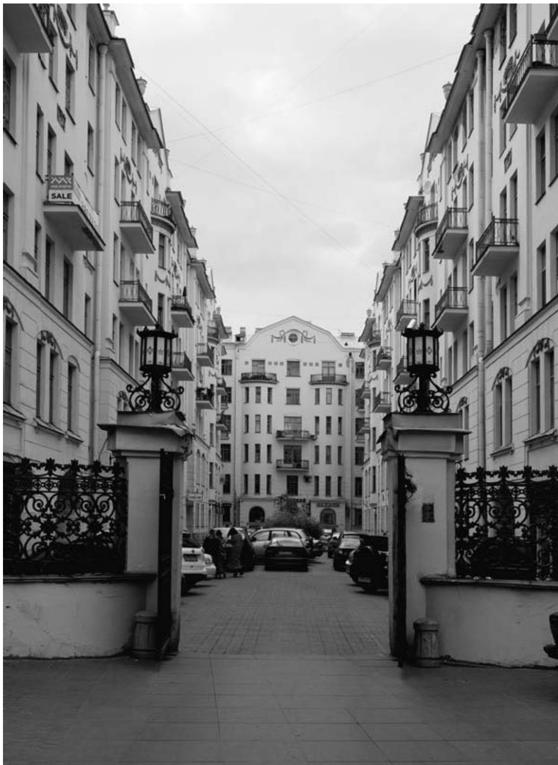
Двор дома 23 по ул. Рубинштейна