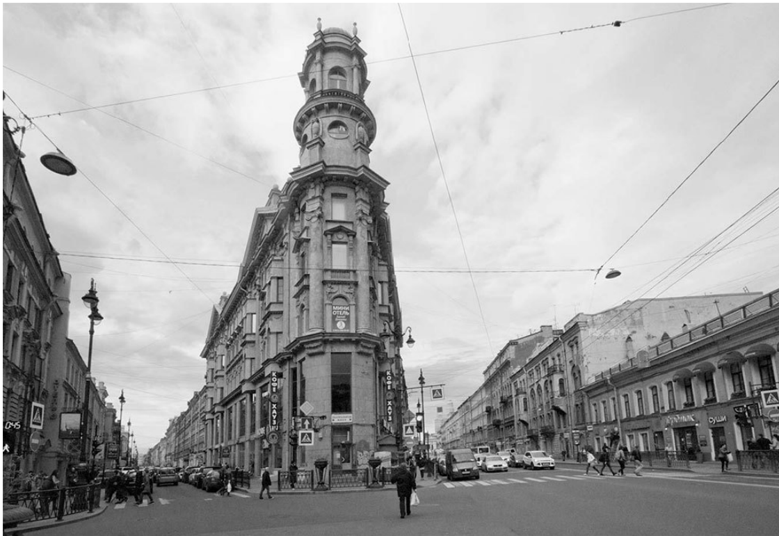
Пять углов. Район ул. Рубинштейна