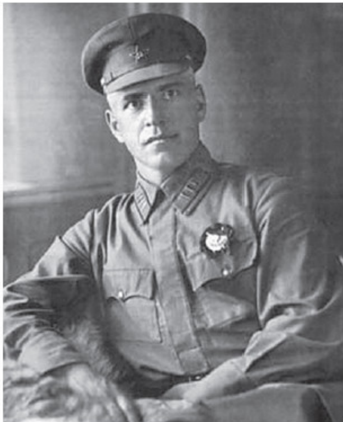
Жуков Георгий Константинович (1896–1974) – полководец, маршал Советского Союза (1943), четырежды Герой Советского Союза, министр обороны СССР (1955–