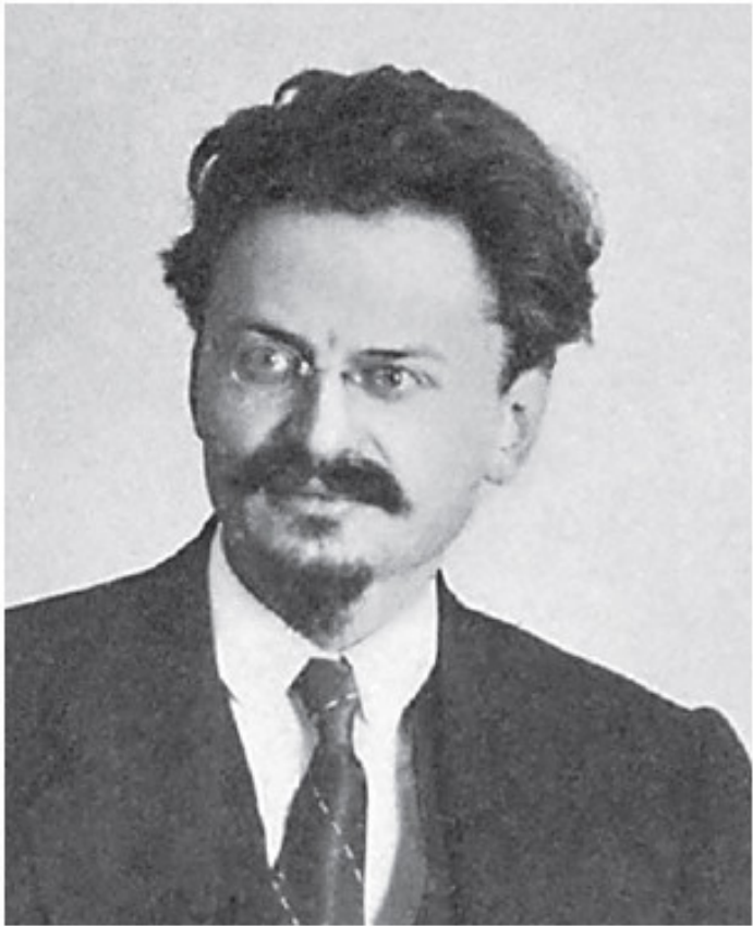
Троцкий Лев Давидович (1879–1940) – революцион-