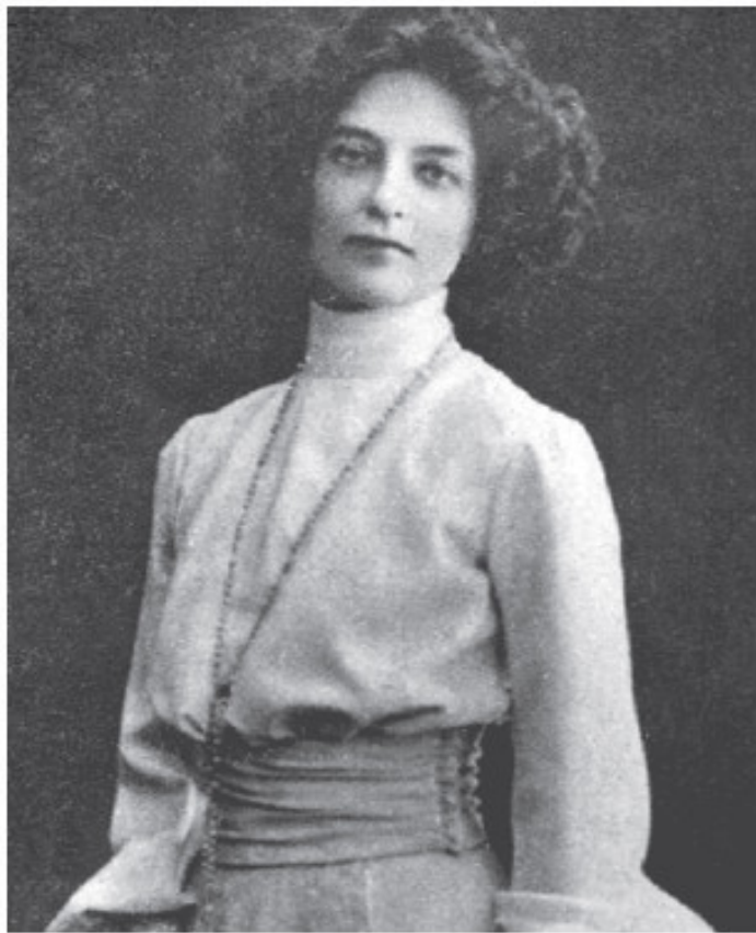
Гиппиус Зинаида Николаевна (1869–1945) – поэтесса и писательница, супруга Д.С. Мережковского. Вместе с мужем вела литературный салон – Религиозно-философские