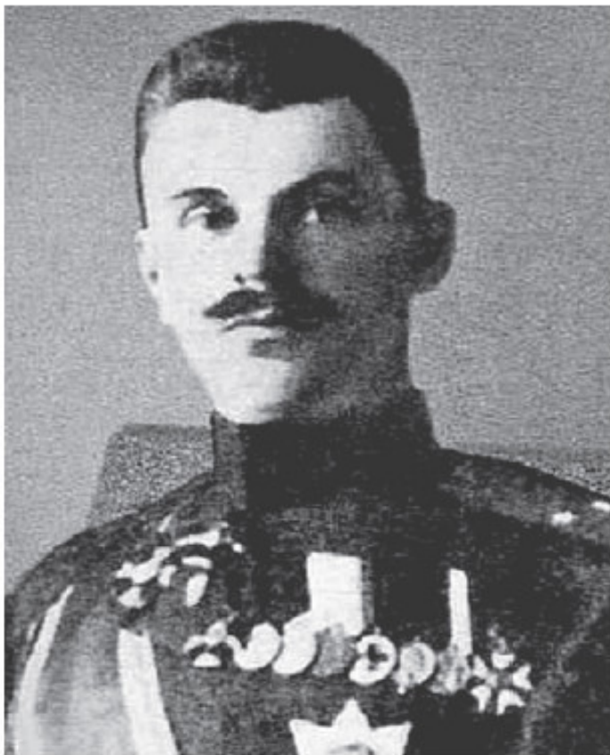
Спиридович Александр Иванович (1873–1952) – генерал-майор Отдельного корпуса жандармов, служащий Московского и начальник Киевского охранного отделения,