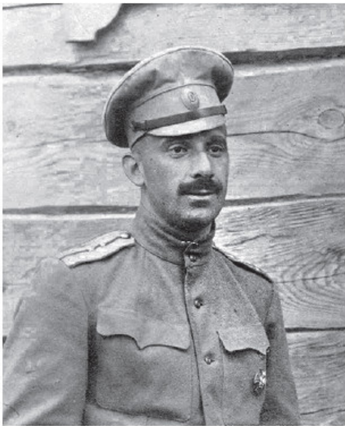
Ходнев Дмитрий Иванович (1886–1976) – полковник.