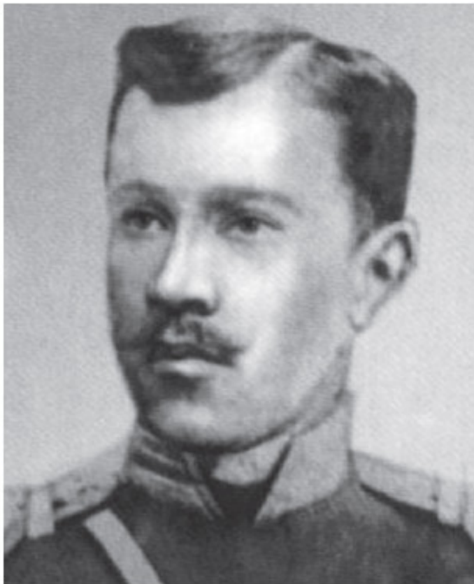
Глобачев Константин Иванович (1870–1941) – генерал-майор, начальник Петроградского охранного отделения. Во время Февральской революции был арестован и находил-