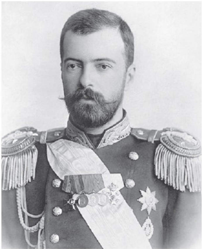
Александр Михайлович (1866–1933) – великий князь,