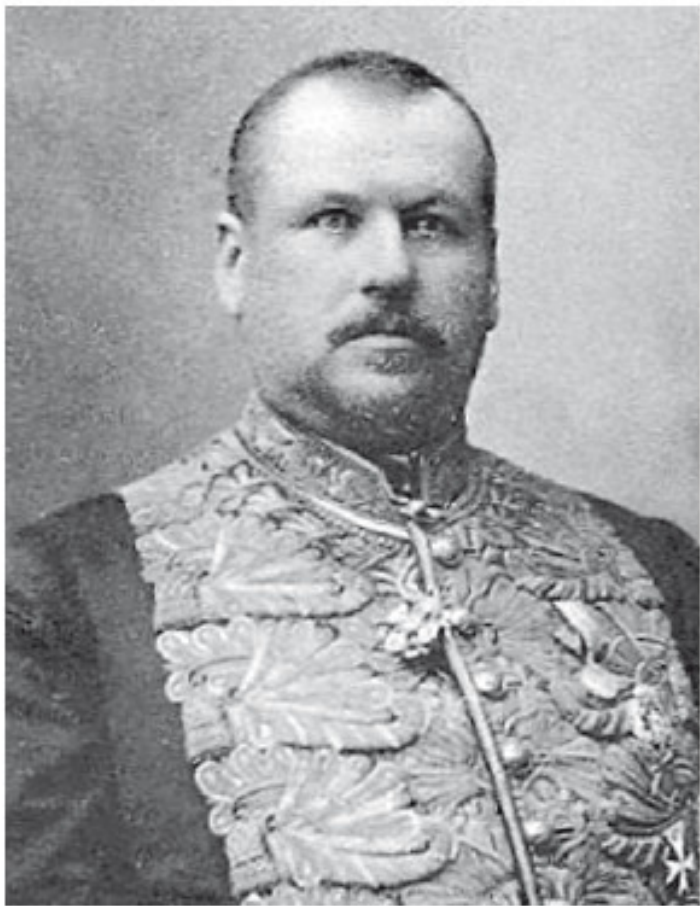
Родзянко Михаил Владимирович (1859–1924) – по-