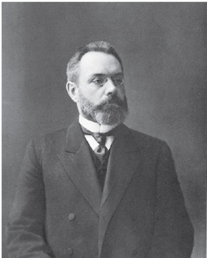
Гучков Александр Иванович (1862–1936) – политический деятель, лидер партии «Союз 17 октября». Председатель III Государственной Думы, член Государственного Со-