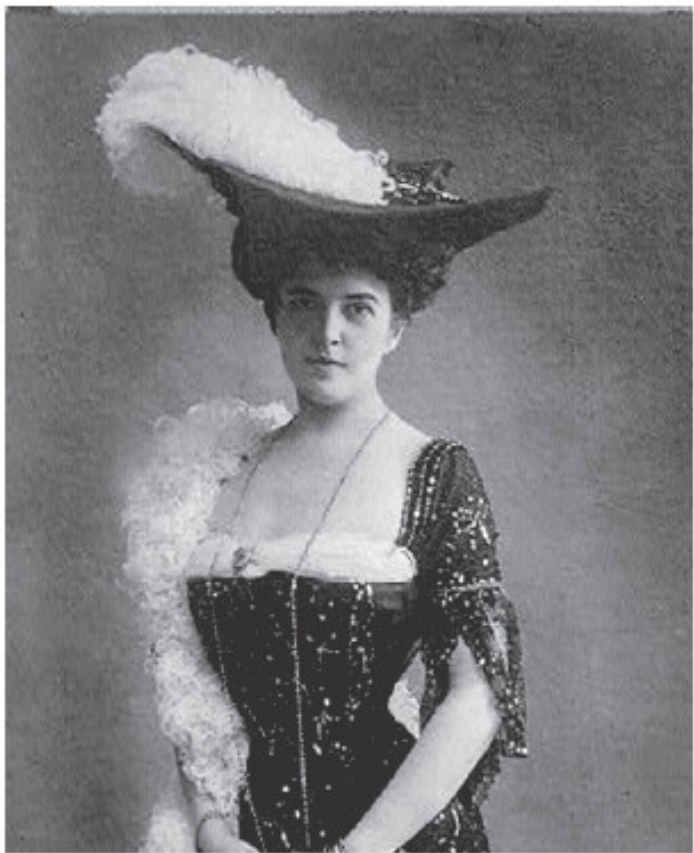
Кантакузина Юлия Федоровна (1876–1975) – литератор, мемуарист. Урожденная Джулия Грант, внучка президента США Улисса Гранта. Жена князя Михаила Михайло-