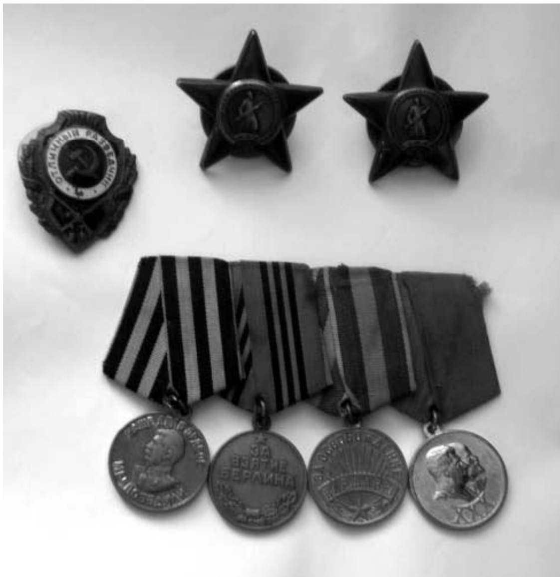
Награды отличного разведчика