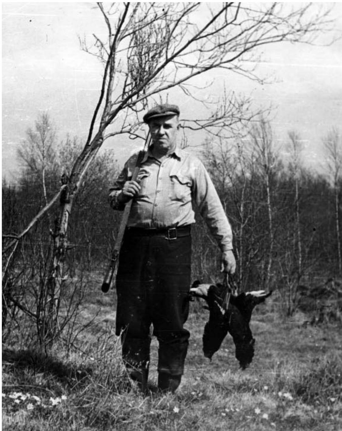
На охоте. 1959 г.

...Я сейчас, став взрослой, сознаю, что у деда были две удивительные особенности. Проведя всю жизнь на флоте, он никогда не ругался матом. Во всяком случае, никто из домашних этого не слышал. Ему и не нужно было материться – достаточно просто строго взглянуть из-под очков. Поэтому у нас дома не принято ругаться. Сын рязанского сапожника, он привил нам всем любовь к книгам и собрал за свою жизнь отличную библиотеку. Может быть, я потому и научилась читать в четыре года, что он позволял мне это делать, сидя на кровати в его комнате. Главное было – сидеть тихо, поэтому приходилось читать.