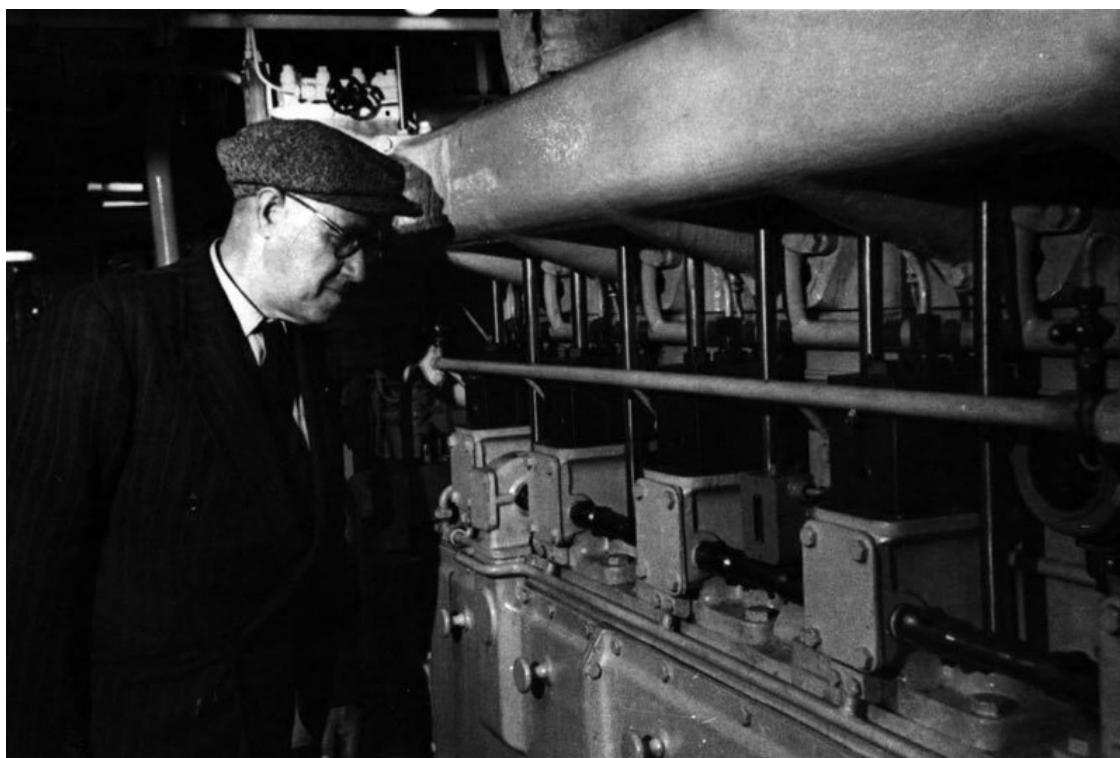
В машинном отделении теплохода «Волголес». 1960 г.

...Я хорошо помню разные его присказки. И скупой смех. И меховую жилетку, в полочку которой я упиралась, сидя на дедовых коленях. Отлично помню его меховую шапку, которую, даже обладая премией в области литературы, затрудняюсь описать: то ли ушанка без ушей, то ли кубанка-маломерок с меховым помпоном на кожаном верхе. Я помню лишь то, что трогало мою детскую душу и интересовало детский ум; например, подарит ли он мне, если хорошо попросить, зеленый треугольный пластиковый кошелечек с кнопочками? Кошелек из пластика он мне, кстати, подарил. Или – что скрывается за дверьми книжного шкафа, помимо старых пыльных книг? И не забудет ли он меня позвать, когда будет набивать патроны? Я же не знала тогда, что мой дед – герой. Мое внимание никто на этом не акцентировал. То есть я никогда в этом не сомневалась, но не осознавала полностью.