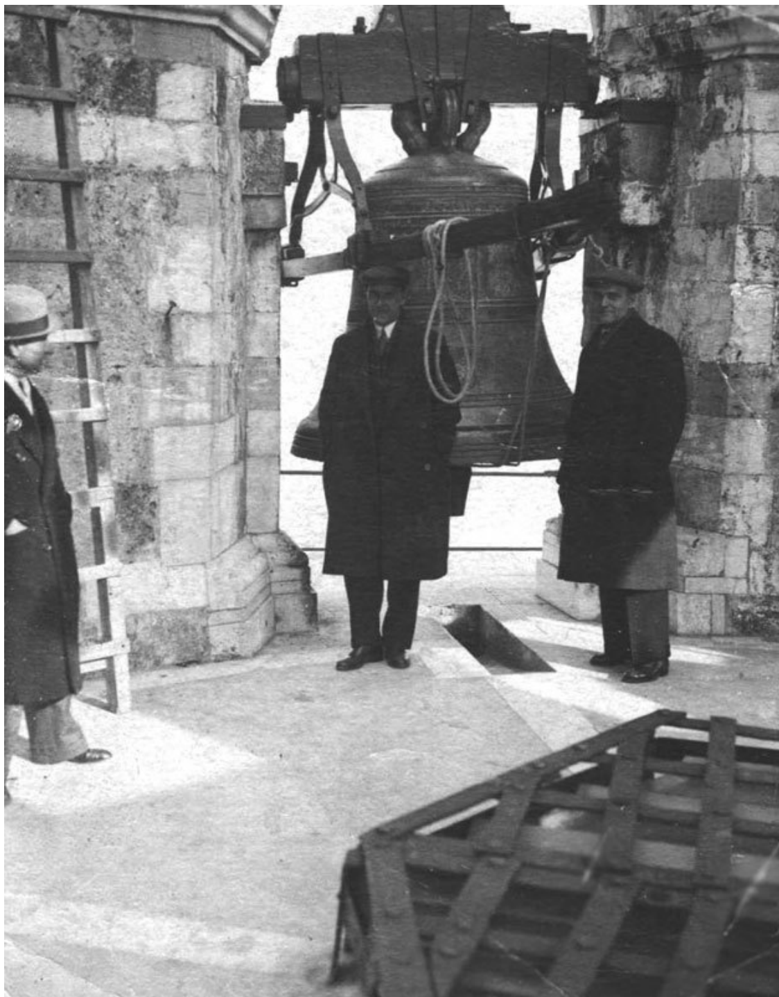
На верхнем ярусе Пизанской башни. Италия. 1933 г.