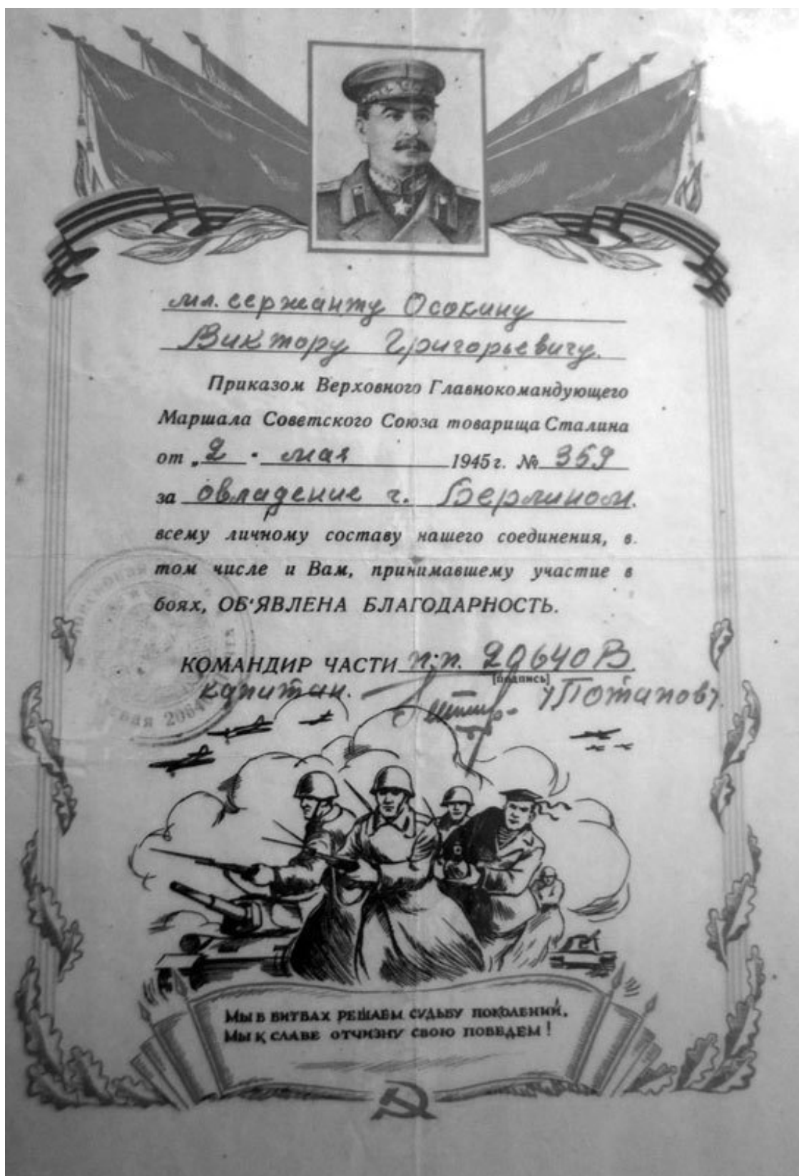
Благодарность за Берлин