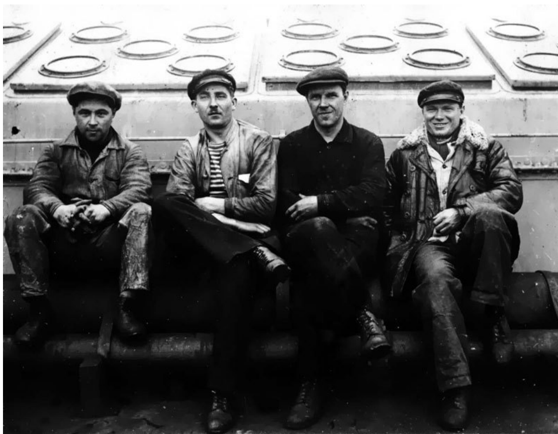
У машинного люка теплохода «Грознефть», дед – второй справа. 1927 г.

Но я-то знаю, что он воевал! Это то небольшое, что мне удалось запомнить из его рассказов: историю про конницу Буденного, где ему посчастливилось бить белых, и про кобылу Мамзель. Я не мальчик, мне скучны описания баталий и даже то, что у дедушки была настоящая пашка, не трогает мою душу. Но его кобыла Мамзель прочно засела в памяти. Именно кобыла – не лошадь.