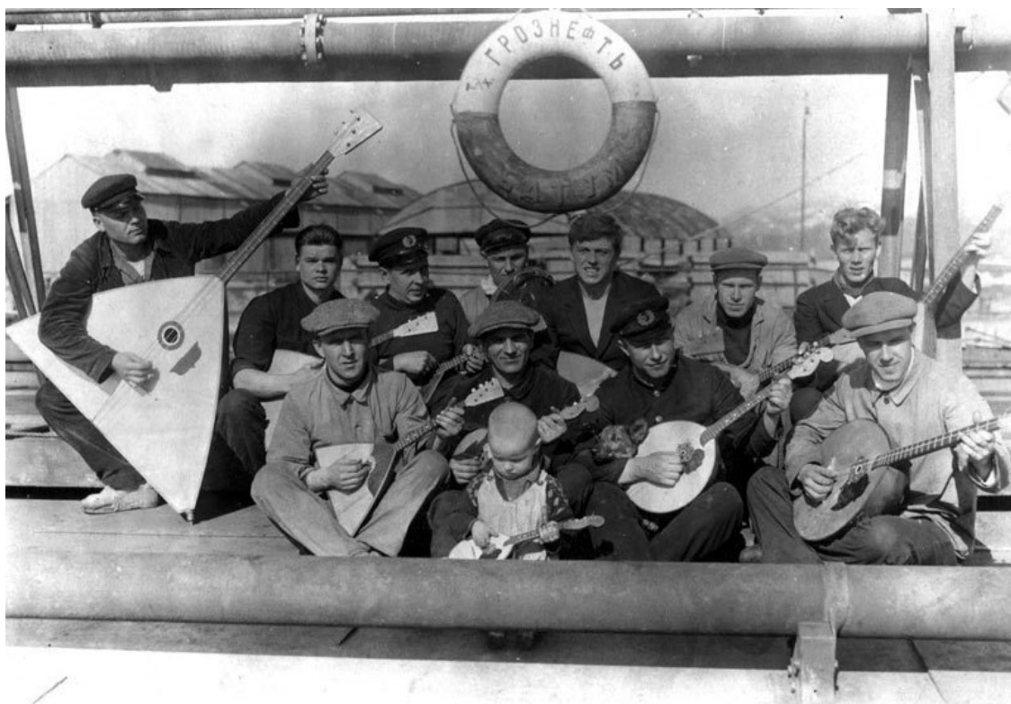
Великорусский оркестр теплохода «Грознефть». 1928 г.