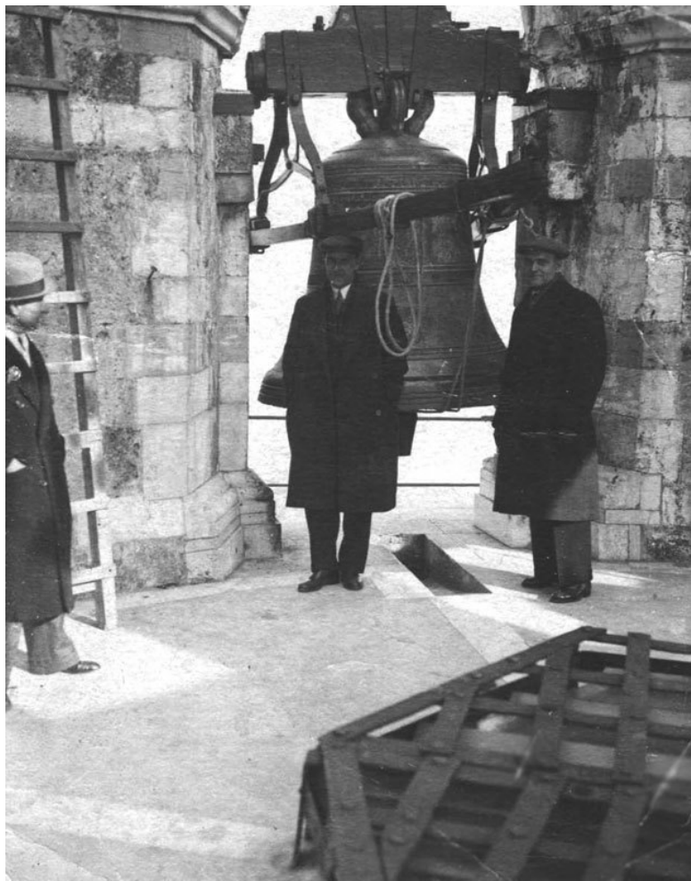
На верхнем ярусе Пизанской башни. Италия. 1933 г.