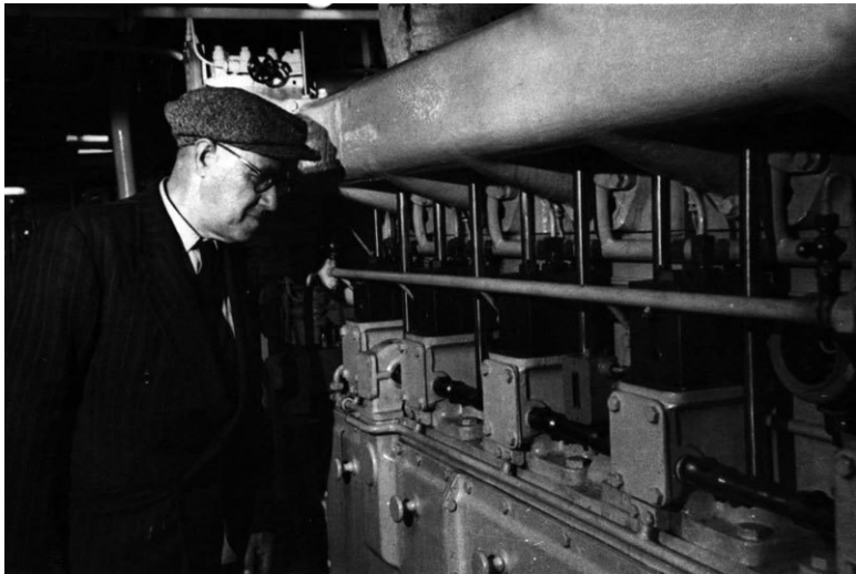
В машинном отделении теплохода «Волголес». 1960 г.