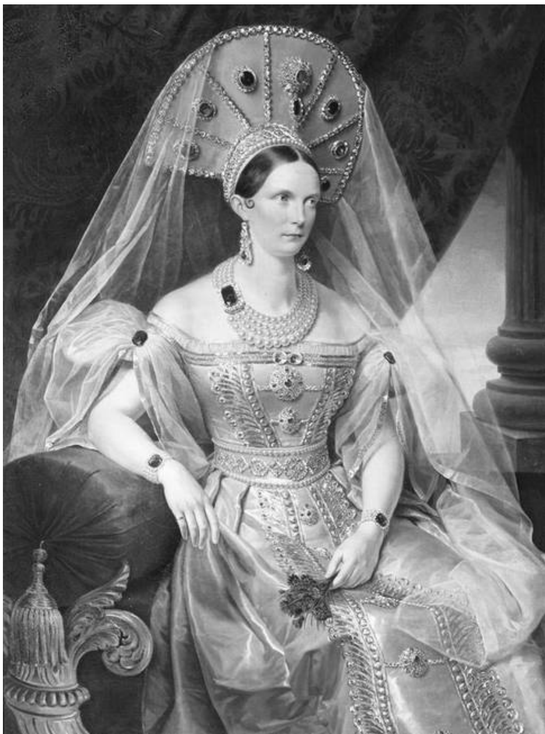
Крюгер Ф. Портрет императрицы Александры Феодоровны. 1836 г. ГЭ

К началу 1826 года в Императорском Кабинете количество всевозможных вещей, предназначенных на подарки, составило сумму 2 228 282 рубля. Однако коронация требовала как больших пожалований, так, соответственно, и больших затрат. Только за первый квартал знаменательного года «ювелирам за работу и за купленные у них и у разных людей бриллиан-