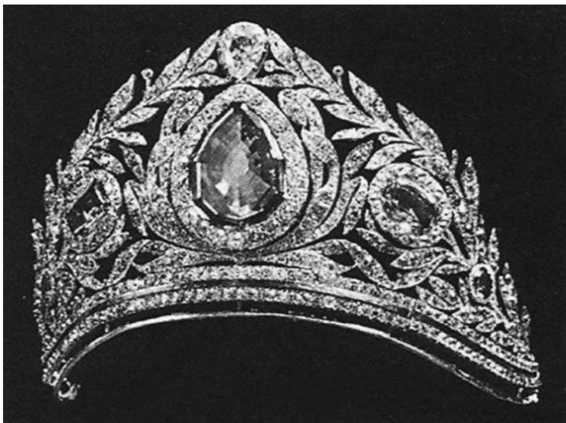
Яков Дюваль. Диадема из Сапфирового убора императрицы Марии Феодоровны, супруги Павла I

«диадему с сафирами и бриллиантами» в 27 100 рублей, под № 365 – «ожерелье с сафирами и бриллиантами» в 39 300 рублей, а под № 366 оказался «фермуар с большим сафиром», оценённый в 88 300 рублей. Все три восхитительные вещи, прельщающие своей красотой, тут же забрала к себе новая императрица Мария Феодоровна, супруга Александра III, 90 знавшая толк в драгоценностях. После Февральской революции дивные украшения матери Николая II реквизируют из Аничкова дворца. А когда окончилась братоубийственная Гражданская война, эксперты под руководством академика-минералога Александра Евгеньевича Ферсмана наконец-то разобрали великолепные творения ювелиров, принадлежавшие членам августейшей семьи Романовых. Вскоре появились на свет и выпуски каталога предметов Алмазного фонда СССР, содержащие помимо описаний и чёрно-белые фотографии.