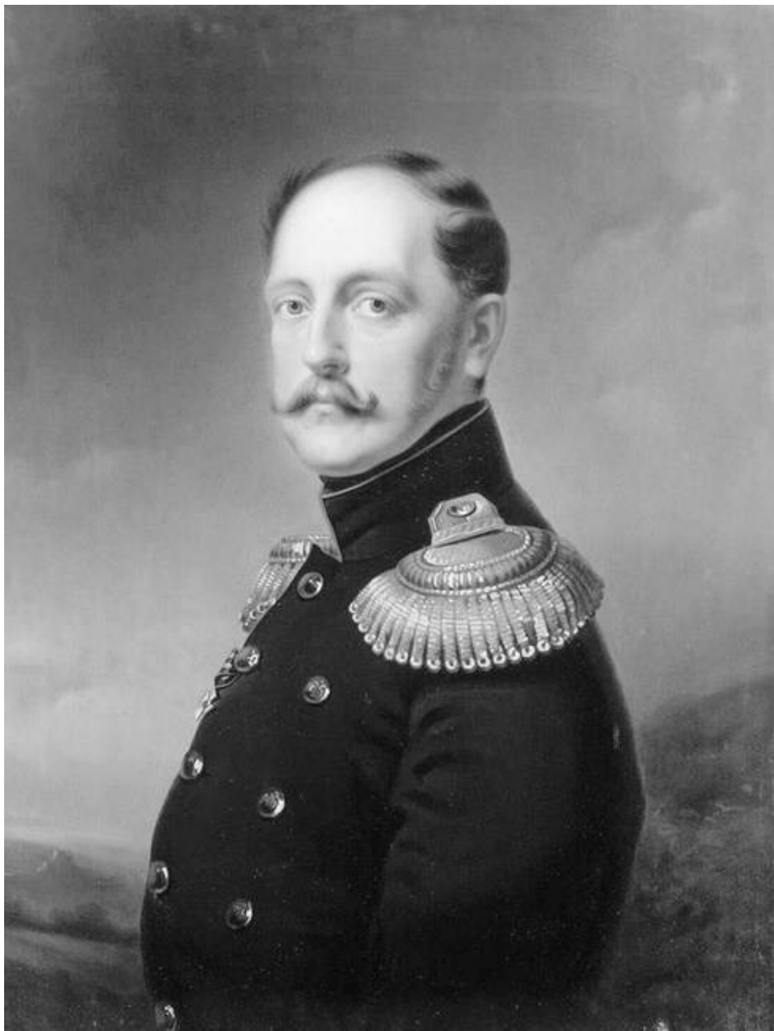
Крюгер Ф. Портрет императора Николая I. 1836 г. ГЭ

товые и другие вещи» причиталось 537 878 рублей 50 копеек. 8 Но это и не удивительно. Ведь всего за 1826 год было роздано драгоценных подарков на сумму 2 550 602 рубля, из них членам императорской фамилии – на 241 596 рублей.