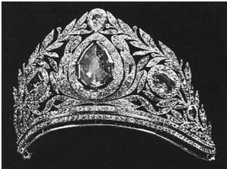
Яков Дюваль. Диадема из Сапфирового убора императрицы Марии Феодоровны, супруги Павла I

нец-то разобрали великолепные творения ювелиров, принадлежавшие членам августейшей семьи Романовых. Вскоре появились на свет и выпуски каталога предметов Алмазного фонда СССР, содержавшие помимо описаний и чёрно-белые фотографии.