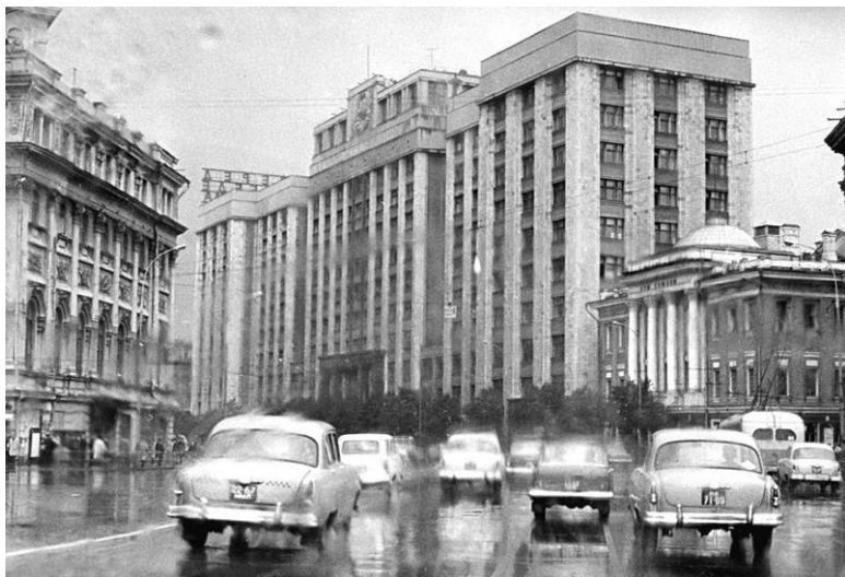
Москва 1960-х гг.

дорожки сбиться. Не хотели родители такой судьбы для своей дочери.