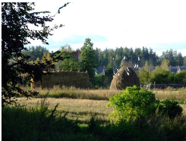
п. Усть-Долыссы

Тем и сильна всегда Россия, Народным духом до конца, Пока таинственная сила Переполняет нам сердца.