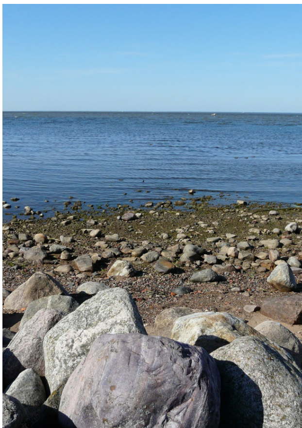
Финский залив