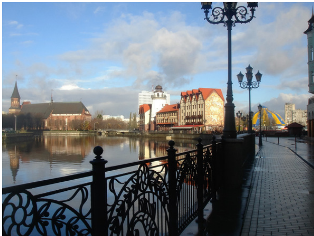
г. Калининград