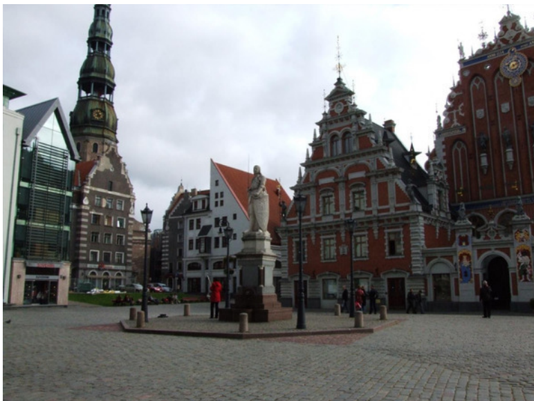
г. Рига