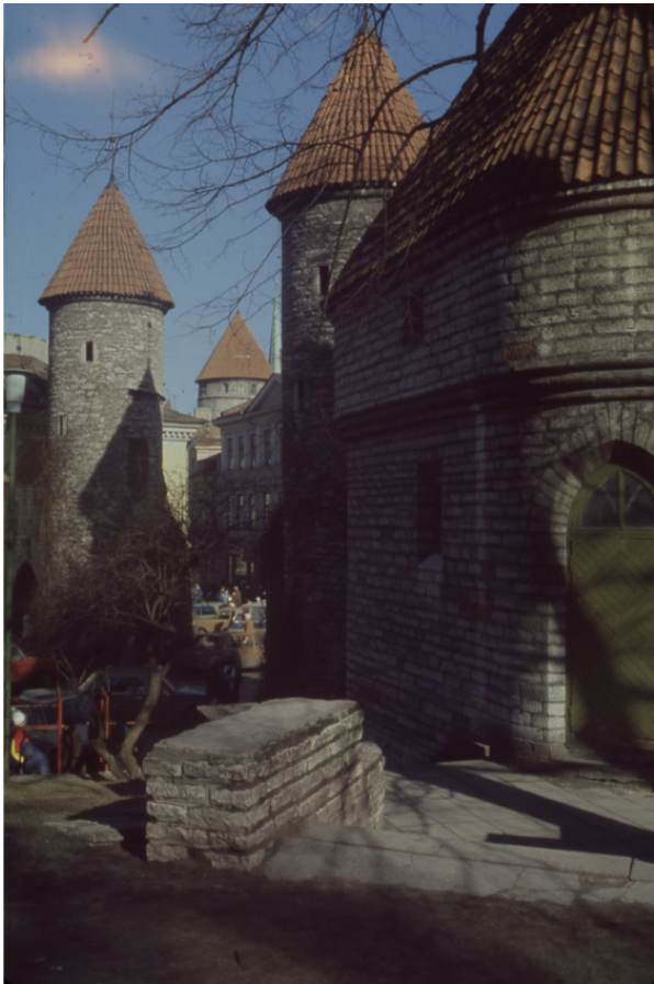
г. Таллин