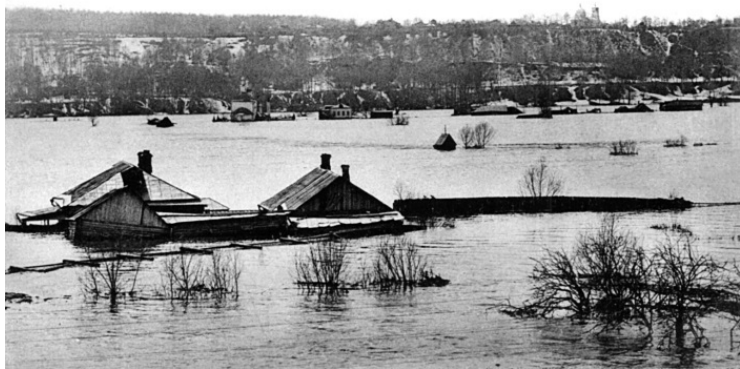
Воробьевы горы и знаменитое наводнение 1908 г.

В XVII веке вносить исправления в столичную стихию взялся будущий император. Петра Великого можно понять – грязно, зловонно, лопухи растут. Да, церквей много, но каков толк от храма, если за пределами своего двора порядок навести не желаешь, дохлые кошки валяются да «иная мертвечина»? При Петре Москва напоминала центральный город только издали: «Народ валом валил вдоль узкой навозной улицы. Из дощатых лавчонок перегибались, кричали купчишки, ловили за полы, с прохожих рвали шапки, – зывали к себе. За высокими заборами каменные избы, красные, серебряные крутые крыши, пестрые церковные маковки. Церквей – тысячи. И большие пятиглавые, и маленькие