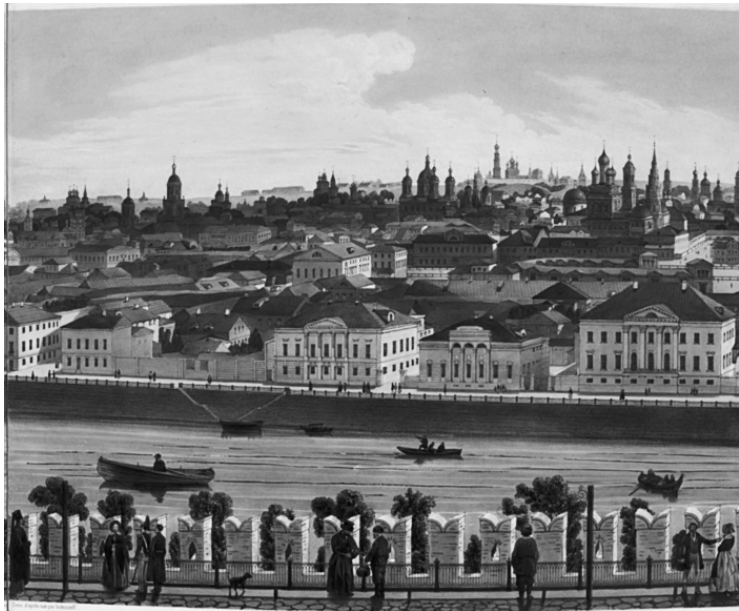
Вид на Замоскворечье. Часть панорамы Д. Индейцева

Но находились же волевые люди и правители, старавшиеся изменить этот издавна заведенный хаос? Да, такие имелись, но вплоть до XIX века Москве удавалось эти попытки успешно игнорировать. Рассмотрим несколько типичных примеров. На заре Московского княжества главным бичом города считались пожары. Порой стихийные бедствия толковались посадской толпой как наказание свыше. В 1493 году очередной «красный петух» уничтожил чуть ли не половину города. Огонь вспыхнул в Замоскворечье и был пере-