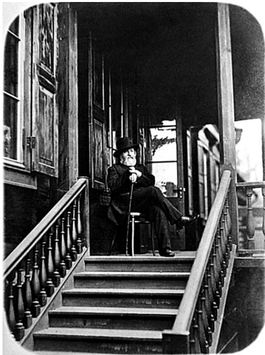
К.Т. Солдатенков, один из самых успешных предпринимателей Москвы XIX века

Общественная атмосфера отличалась вольностью и непринужденностью: «Зима 1857/58 года была в Москве до крайности оживлена. Такого исполненного жизни, надежд и опасений времени никогда прежде не бывало... В обществе, даже в салонах и клубах только и был разговор об одном