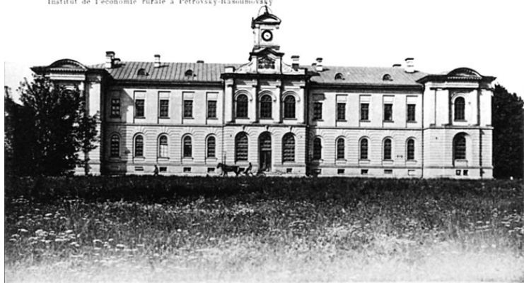
МОСКВА. — MOSCOW. № 32. Сельско-Хозяйственный Институт в Петровско-Разумовскомъ Institut de l'économie rurale à Petrovsky-Razoumovsky

Главное здание Петровской академии, возведенное в 1860-е годы