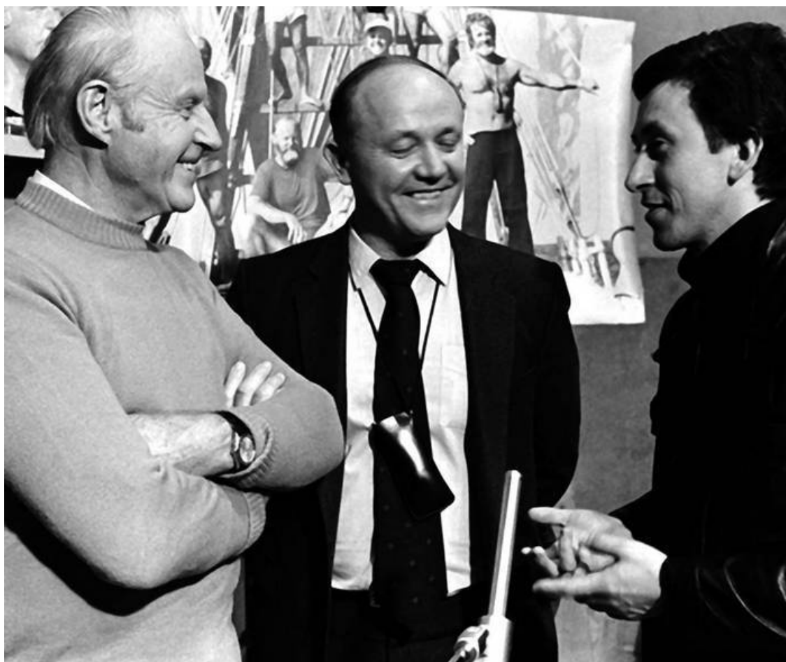
Тур Хейердал, Юрий Сенкевич и летчиккосмонавт Олег Атьков во время визита путешественника в Москву. 1984 г.

«Люди современного большого города ослеплены уличным освещением, они лишились звездного неба. Космонавты пытаются вновь обрести его»