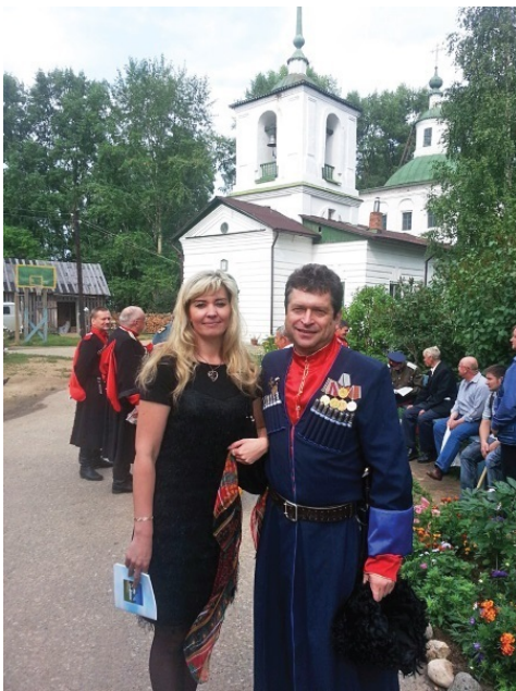
На присяге казаков в Красноборске

казацкими общинами и таким образом положили основание “Всевеликому Войску Донскому”, с его древним вечевым управлением». (Савельев Е.П. Древняя история казачества. 2010. С. 263–267).