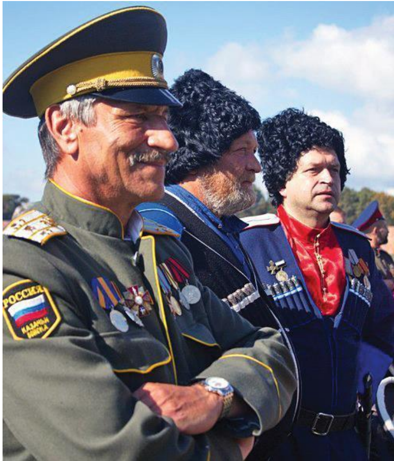
Казачий сбор на «кулачных боях» в Великом Новгороде в честь Дня Александра Невского